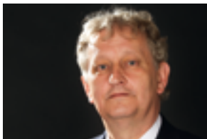
Eberhard van der Laan Burgemeester van Amsterdam, Voorzitter Taskforce.