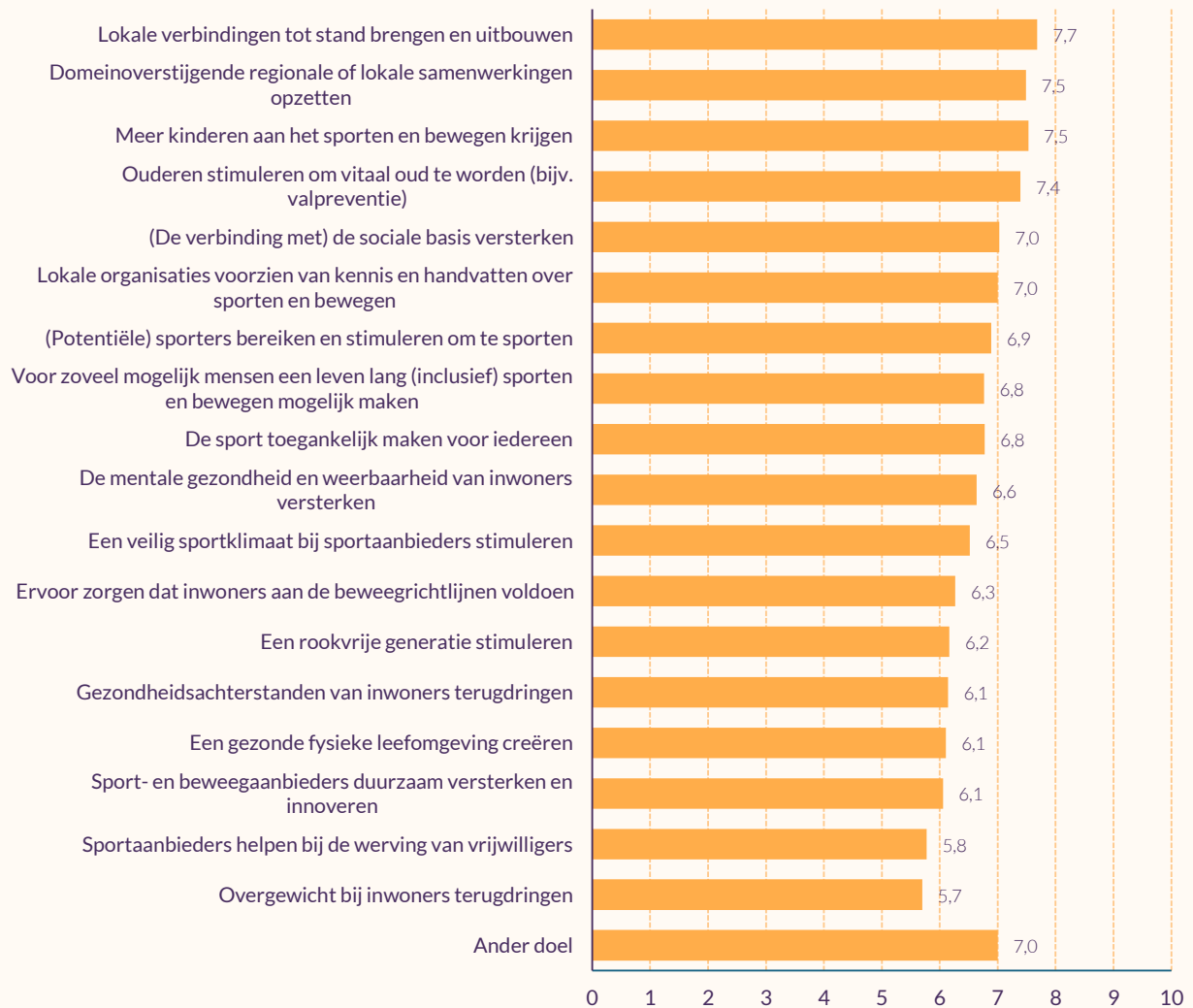
Figuur 4.1 Resultaten* geboekt op de doelen (volgens buurtsportcoaches) (gemiddelden, n=74)

In de panelpeiling hebben we buurtsportcoaches gevraagd naar het resultaat dat zij hebben geboekt op de eerder genoemde doelen (figuur 4.1).