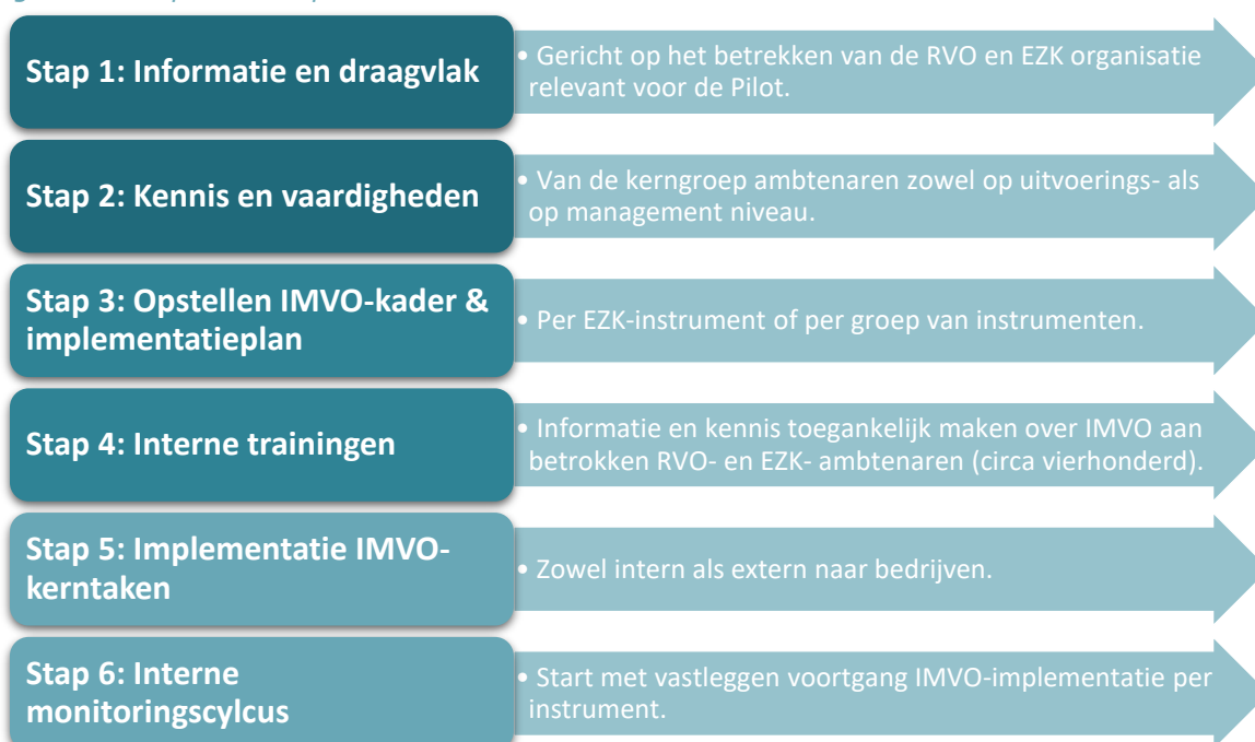
Figuur 2: Aanpak IMVO-pilot

De doelstelling van de pilot was om voor alle geselecteerde instrumenten een werkwijze in te richten om IMVO-kerntaken 1 (informer)en en 2 (adviseren), en voor een beperkt aantal instrumenten ook de IMVO-kerntaken 3 (beoordelen) en 4 (monitoren) toe te passen. Zie bijlage 7.2 voor een uitgebreidere beschrijving van deze IMVO-kerntaken. Onderstaand een beknopte beschrijving van de aanpak van de pilot.