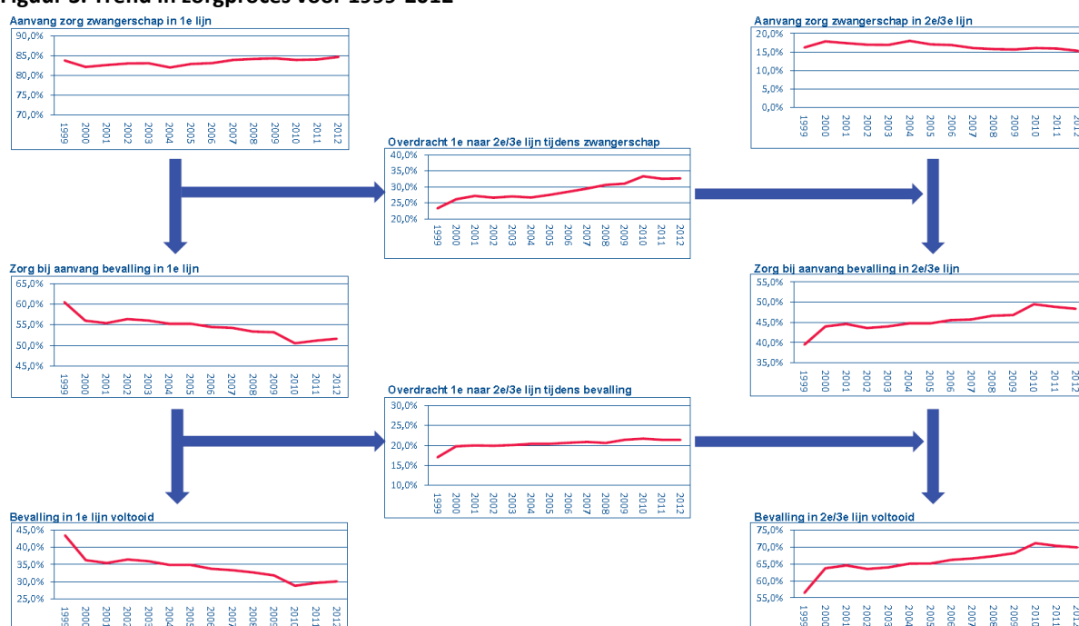
Figuur 3. Trend in zorgproces voor 1999-2012

Bron: Perinatale Registratie Nederland, Grote Lijnen 1999-2012, december 2013.