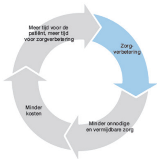
Figuur 1. Kwaliteitsverbetering als vliegwiel voor kostenbesparing (Booz&Co 2012)

Het vliegwiel om kwaliteit te verbeteren en tegelijkertijd kosten te besparen is niet makkelijk in gang te zetten en te houden. Een systematische en gezamenlijke aanpak van zorgverleners, ziekenhuizen 1 , verzekeraars en patiënten is nodig om de kwaliteit daadwerkelijk te verbeteren en om te werken aan het reduceren van de kosten voor de zorg. Dit is ook waar Klink voor pleit in het rapport 'Kwaliteit als Medicijn: Aanpak voor Betere Zorg' 2 . Het Amerikaanse Institute of Medicine stelt dat een lerend systeem waarin een permanente en planmatige verbetercyclus wordt uitgevoerd door alle partijen in de zorg hiervoor de basis is. Ook het Zorginstituut Nederland streeft naar een dergelijke cyclus.