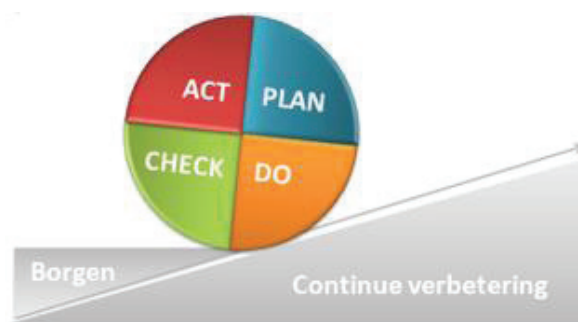
Figuur 2: Kwaliteitscyclus/ Deming cyclus