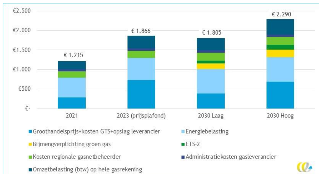
Figuur 1 - Ontwikkeling gasrekening in de tijd in euro per jaar incl. btw, voor een gemiddeld huishouden 1

Een stijgende gasrekening prikkelt tot het nemen van duurzaamheidsmaatregelen, zoals energiebesparing, en helpt daardoor de voortgang van de energietransitie. Het is echter een probleem voor die groepen huishoudens die én niet mee kunnen bewegen met de energietransitie (en daardoor ook geen aanspraak kunnen maken op de daarvoor bestemde subsidies) én hun energierekening niet of bijna niet kunnen betalen. We noemen dat hier: ‘de kwetsbare huishoudens’. Het aantal huishoudens met ‘energiearmoede’ in Nederland bedraagt tenminste 400.000, en is stijgend. Dat vormt een groeiend risico voor het draagvlak voor de energietransitie, en ook voor het tempo ervan.