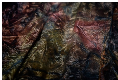
Afbeelding 1. Detail van de één van de jurken uit het Palmhoutwrak in Museum Kaap Skil op Texel.

Met deze verkenning beoogt de RCE meer inzicht te verkrijgen in de wensen, mogelijkheden en knelpunten ten aanzien van de samenwerking tussen de verschillende betrokken partijen. Doel is om te komen tot een voorstel voor samenwerking op het gebied van onderzoek, bescherming (beleid) en kennisdeling van de archeologie in het Noord-Hollandse Waddengebied.