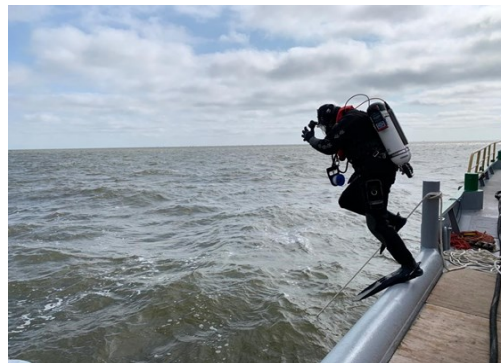
Afbeelding 3. Duiker te water.

Tot de vaststelling van de nieuwe beleidskaart voert de gemeente selectief beleid uit: archeologische vondsten worden pas in beeld gebracht “als men erover struikelt”. Er ontbreekt een actief beschermingsregime. Hollands Kroon ziet de nieuwe verwachtingskaart wel als een hulpmiddel dat het bewustzijn straks kan doen vergroten. Voor nu geldt echter dat onderzoek, toezicht en handhaving bij de gemeente onderbelicht blijven, omdat de gemeente slechts over één fte erfgoedcapaciteit beschikt voor al het erfgoed – goed voor ongeveer 1 à 2 uur per week aan ambtelijke capaciteit voor archeologische werkzaamheden. Om de beperkte ambtelijke capaciteit te compenseren is een dienstverleningsovereenkomst met AWF gesloten. De gemeente voert geen toezicht en handhaving uit op zee, want er is geen vaartuig tot beschikking. Bovendien is tot op heden volgens AWF niet duidelijk wie vrijwilligers met een ontheffing op de Erfgoedwet kan controleren. Zo zou zowel de politie als de kustwacht beide juridisch gezien niet kunnen handhaven, daarom wordt deze kwestie door de Erfgoedinspectie verder onderzocht.