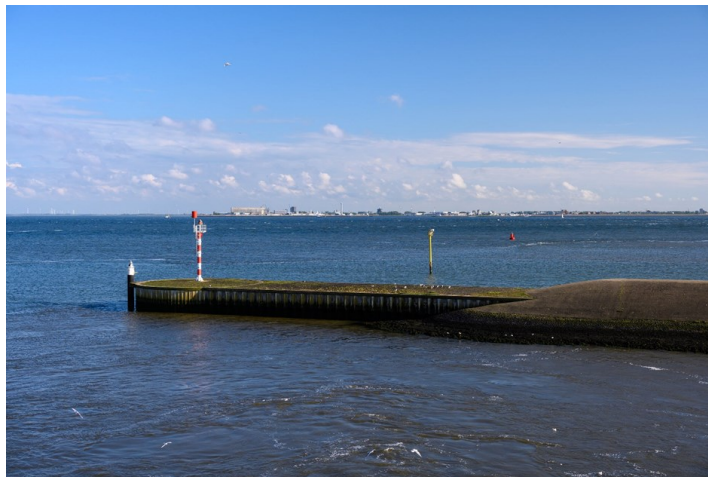
Afbeelding 4. Zicht op Den Helder vanaf Texel.

Op dit moment bestaat er een juridische lacune wanneer verstoring plaatsvindt zonder duidelijk veroorzaker; het Verdrag van Malta dekt die gevallen niet. Hollands Kroon stelt dat Den Haag deze leemte moet dichten en vervolgens onderzoek en maatregelen gefinancierd kunnen worden op basis van behoeftes. In het droomsценario beschikken Texel, Den Helder en Hollands Kroon gezamenlijk over een structureel budget—bijvoorbeeld een meerjarig fonds van gemeenten—om jaarlijks substantieel in veldonderzoek, beleid en ontheffingen te investeren. Wat betreft een structurele inbedding pleit Hollands Kroon voor een regionaal kernteam onder aanvoering van AWF, dat al korte lijnen onderhoudt met strandvinders, sportduikers en (maritieme) archeologen. Specialistische taken zoals monitoren en waarde-rend duikonderzoek blijven belegd bij experts, maar de gemeente wil samen met de AWF een stevige, gedeelde organisatorische basis leggen om het erfgoed systematisch te verkennen en beschermen.