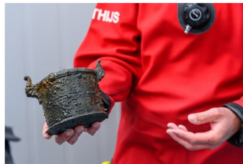
Afbeelding 6. Archeologische vondst uit het Palmhoutwrak.

In het geval er (nog) geen regionaal team is, blijkt uit de interviews dat een samenwerking met gemeenten alleen van de grond kan komen als er ook budget beschikbaar wordt gesteld voor gemeenten. Op dit moment wordt vooral reactief gehandeld door de gemeenten, bijvoorbeeld bij toevalsvondsten. Het ontbreekt aan structureel beleid, toezicht en handhaving om de archeologie te behouden, (wanneer nodig) te onderzoeken en toevalsvondsten te kunnen converseren. Voor structurele inzet hiervoor is financiering essentieel. De gemeenten benadrukken de behoefte aan onderzoek en de benodigde expertise in eigen organisatie, dus binnen de gemeente zelf. Met structurele financiële basis kan bovendien opwater-onderzoek worden uitgevoerd, zodat de archeologische verwachtingkaarten kunnen worden aangescherpt.