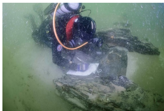
Afbeelding 7. Het onderzoek naar wrak BZN 9.

Zowel binnen als buiten een regionaal kernteam is er behoefte aan een structureel samenwerkingsmodel waarbij sportduikers een rol kunnen spelen als 'ogen en oren' onder water. Daarom wordt een aanvullend onderzoek aanbevolen dat zich richt op het inventariseren van bestaande initiatieven en samenwerkingen met duikverenigingen, het verkennen van mogelijkheden om binnen de huidige wet- en regelgeving, of via aanpassing daarvan (zoals de Arbowet en Erfgoedwet), sportduikers op verantwoorde wijze in te zetten bij opsporing en documentatie, het ontwikkelen van protocollen en opleidingen die veilige en verantwoorde