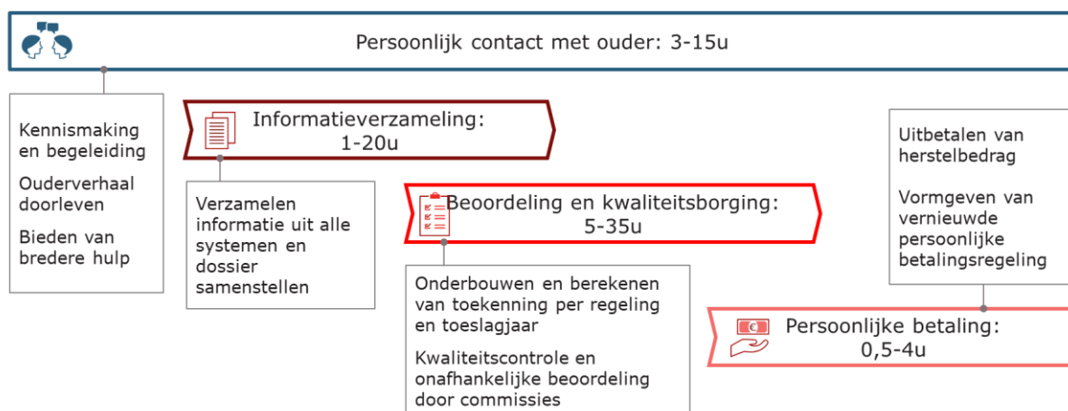
Figuur 3: Indicatie behandelijd per ouder voor herstelactiviteiten

Mijn belangrijkste conclusie uit figuur 3 is dat – na toepassing van de gekozen versnellingsoptie, optie 4 – verdere versnelling in het proces niet mogelijk is zonder afbreuk te doen aan de centrale uitgangspunten van de hersteloperatie. De voornaamste tijdsbesteding in het herstelproces zit namelijk in het individuele contact en maatwerk richting ouders inclusief het indien nodig helpen van ouders met aanvullende hulpvragen bij derden (~15-20%), in het verzamelen van informatie om de situatie van de ouders in kaart te brengen en het verhaal van de ouder te bevestigen (~30%), in het waarborgen van de consistentie en zorgvuldigheid van de beoordeling, zeker bij zaken waarin de ouder op basis van de regelingen geen (volledig) herstel kan krijgen (~40%), en in het vormgeven van een persoonlijke betaling rekening houdend met de situatie van de ouder (~10-15%). Het versnellen van deze activiteiten doet dus ofwel afbreuk aan de maatwerk hulp die we de ouder bieden ofwel aan de zorgvuldige, individuele beoordeling van de situatie van de ouder. Dit loslaten zou niet in lijn zijn met de afspraken die ik eerder met uw Kamer heb gemaakt en met de regelingen die ten behoeve van de hersteloperatie zijn ontworpen.