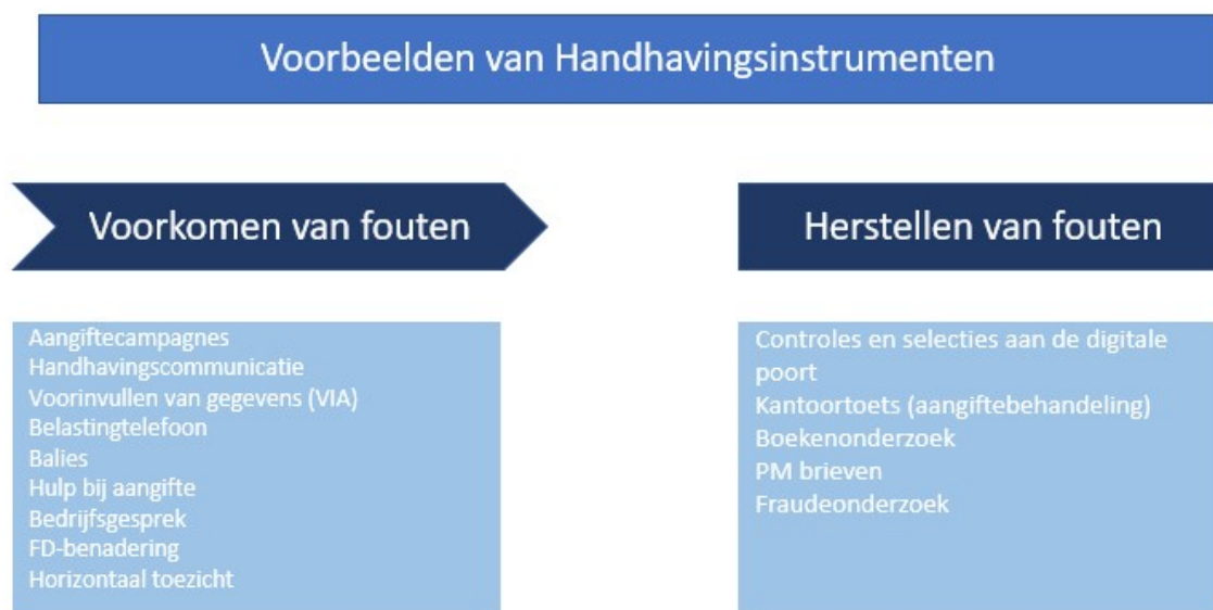
Figuur 4: Voorbeelden van Handhavingsinstrumenten die gericht zijn op het voorkomen van fouten of het corrigeren van fouten.

In figuur 4 zijn voorbeelden van handhavingsinstrumenten opgenomen die enerzijds erop zijn gericht om fouten te voorkomen en anderzijds om fouten te corrigeren.