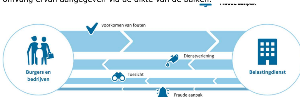
Figuur 1: Schematische weergave van de uitvoering- en handhaving door de Belastingdienst.

In Figuur 1 worden de activiteiten van de Belastingdienst schematisch weergegeven, met de relatieve omvang ervan aangegeven via de dikte van de balken.