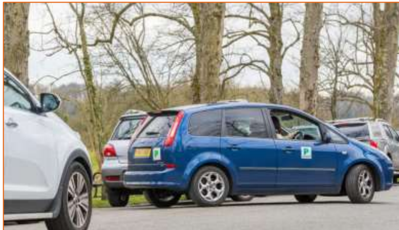
Figuur 5: Voorbeeld van een P-plate