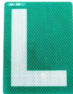
Figuur 6: L-plaat in Spanje

In Spanje is sinds 1960 een dalende trend zichtbaar in het aantal ongevallen. Het aantal dodelijke ongevallen van 9.344 is gedaald naar 1.680 in 1989. In 2019 was het aantal dodelijke ongevallen echter weer gestegen naar 1.755 (Road Safety Strategy 2030, p.15). Enkele belangrijke oorzaken van ongevallen zijn afleiding in het verkeer (onder andere door mobiele apparaten) en rijden onder invloed van alcohol of drugs. Meer dan de helft van de ongevallen (53%) vindt plaats onder de kwetsbare groepen en modaliteiten, zoals voetgangers, fietsers en motorfietsers. Ook ouderen (boven de 65 jaar) komen naar voren als groep waarbinnen verhoudingsgewijs meer ongevallen plaatsvinden. In Spanje zijn beginnende bestuurders (die minder dan een jaar in het bezit zijn van hun rijbewijs) verplicht om een groene plaat met de letter 'L' op de auto te plaatsen (zie figuur 6).