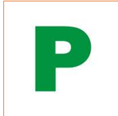
Figuur 4: Voorbeeld van een P-plate

De verschillende constituerende landen van het Verenigd Koninkrijk kunnen zelf hun eigen regelgeving bepalen op het gebied van rijbewijzen en verkeersveiligheid. Voor beginnende bestuurders betekent dit in de praktijk echter dat alleen Noord-Ierland een afwijkend systeem heeft en dat de systemen in Engeland, Schotland en Wales hetzelfde zijn. Voor deze studie is in principe alleen gekeken naar Engeland, andere relevante aspecten uit andere gebieden worden voor de volledigheid echter ook meegenomen. In Engeland moeten beginnende bestuurders (die minder dan een jaar geleden hun rijbewijs gehaald hebben) een witte sticker met de letter 'P' op de auto plaatsen (zie figuur 4).