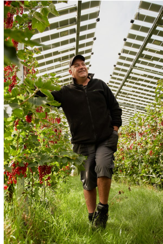
Rode bessen onder zonnepanelen

Coöperatie met 400 leden, met 5.500 hectare fruitareaal verspreid over heel Nederland en een klein deel in België. Erkende producentenorganisatie voor appel, peer, aardbei, rode en blauwe bessen, frambozen en bramen.