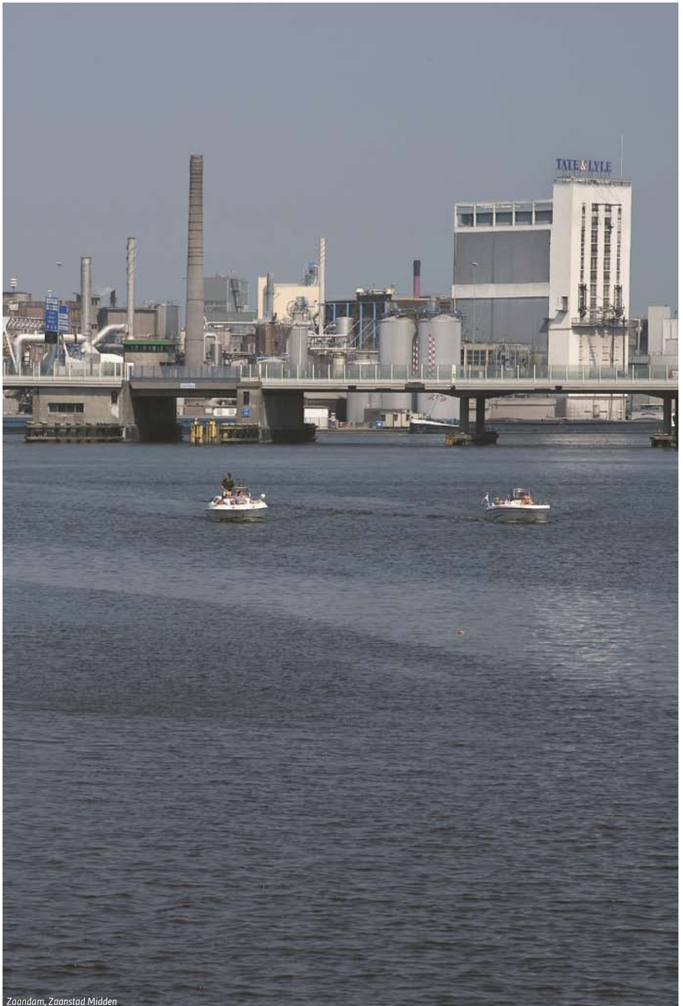
Zaandam, Zaanstad Midden