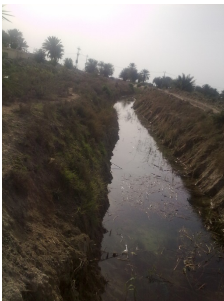
Schoongemaakt deel van het kanaal

Uit gesprekken met de stamhoofd van Al Bo Jawali blijkt dat de lokale overheid gestart is met onderhoudswerkzaamheden aan het irrigatiekanaal. De lokale overheid werkt nu samen met het directoraat van Landbouw, directoraat van Irrigatie en directoraat van Water Resources om het project nieuw leven in te blazen. Er is reeds een start gemaakt met het schoonmaken van delen van het kanaal. Dit gebeurde nadat de lokale overheid aanvullende financiering heeft ontvangen van de Centrale Overheid. Een initiatief van de minister-president om de landbouwsector in Irak te verbeteren.