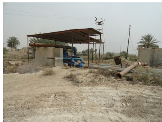
Waterpompen in het dorp Sayed Nasir