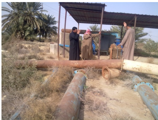
De begunstigden met de pompen en leidingen

Aan de Eufraat zijn twee elektrische waterpompen geïnstalleerd, deze pompen zijn aangesloten op twee 8 inch pijpleidingen. De elektriciteit voor de pompen is afkomstig van een transformator, dat speciaal voor hen gebouwd is en kunnen worden bediend vanuit een elektrisch paneel.