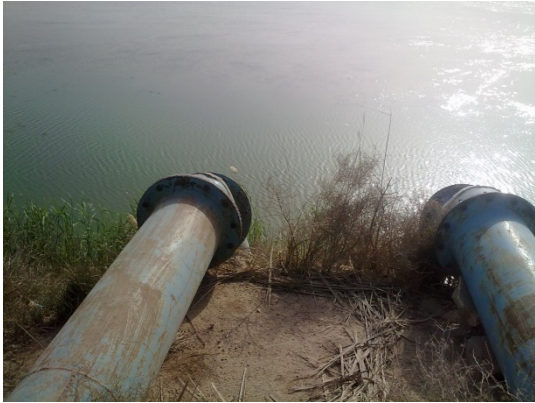
De pijpleidingen van de pomp naar de Eufraat