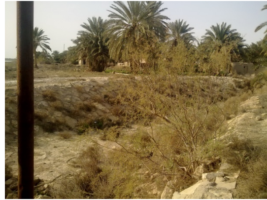
Begin van het irrigatiekanaal, nabij de Eufraat