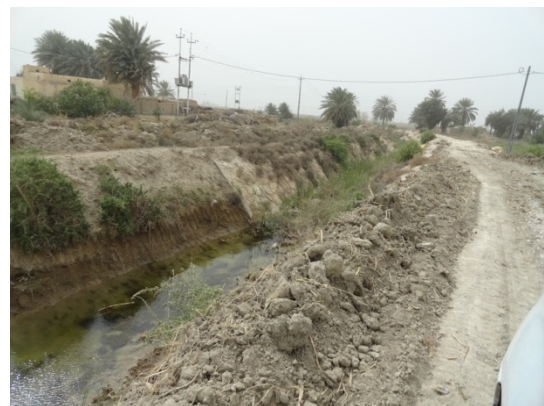
Begin van het irrigatiekanaal, nabij de Eufraat