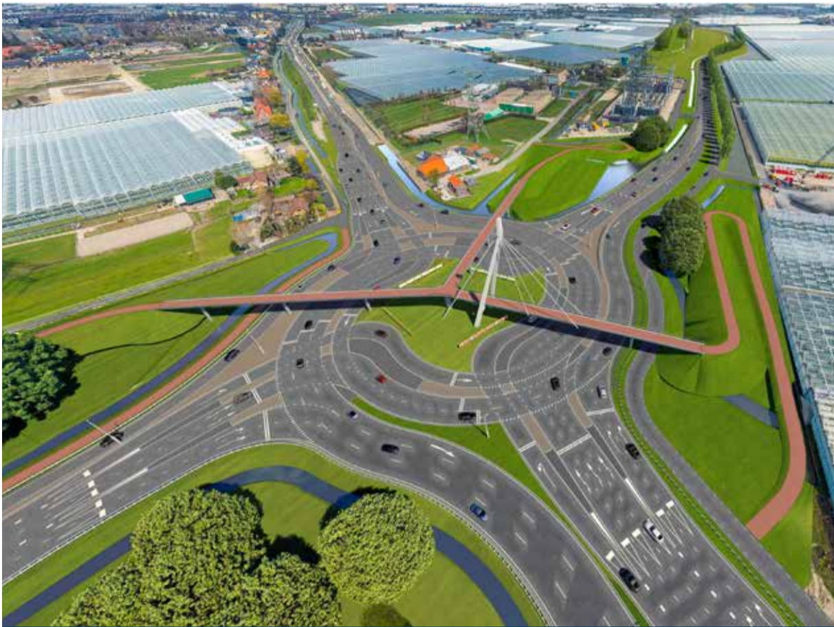
Dit fietsviaduct komt over het nog aan te leggen Vlietpolderplein in gemeente Westland. Met het fietsviaduct herstellen en optimaliseren we de oude fietsverbindingen en vergroten we de fietsveiligheid. Het fietsviaduct is een van de maatregelen die genomen wordt voor een betere bereikbaarheid van Westland en Hoek van Holland. De provincie Zuid-Holland trekt dit project