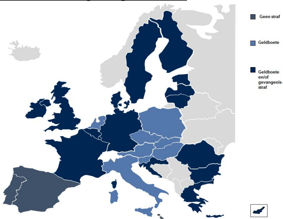
Tabel 10: Strafbaarstelling van illegale binnenkomst