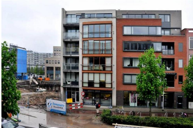
Figuur 2 Casus Het scheve huis