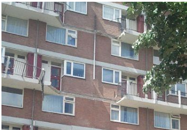
Figuur 3 Casus Antillenflat

De Antillenflat in Leeuwarden haalde in mei 2011 het landelijke nieuws toen daar vijf galerijplaten bezweken en instortten. Bij het incident vielen geen slachtoffers, maar de woningen in het appartementencomplex uit de jaren '60 zijn wel direct ontruimd. De casus is hier ingezet als model voor een situatie waarin het bevoegd gezag een nader onderzoek heeft laten uitvoeren naar de oorzaak van de instorting. De vraag was welke gegevens je als bevoegd gezag nodig hebt om in zo'n nader onderzoek effectief te kunnen optreden.