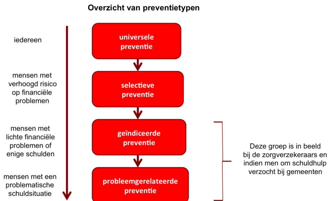
Figuur 2: Overzicht van preventietypen

Schuldpreventie is in te delen in vier typen preventie: universele, selectieve, geïndiceerde en probleemgerelateerde preventie. De vier typen zijn ingedeeld naar de groep waar de preventie zich op richt. Uitgedrukt in het jargon van de zorgverzekeringen is universele preventie gericht op alle verzekerden. Selectieve preventie richt zich op de groep waarbij sprake is van een verhoogd risico op wanbetaling. Geïndiceerde preventie is gericht op de groep die een of enkele maanden achterstand hebben. Probleemgerelateerde preventie richt zich op de groep die in de bronheffing zit en/of in een problematische schuldsituatie.