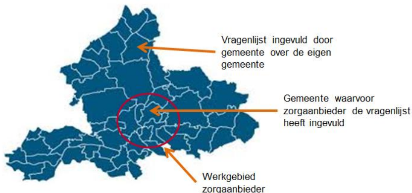
Figuur 1.1 Gemeenten en aanbieders in de onderzoekspopulatie

Zoals in de inleiding aangegeven, was het in kaart brengen van de geboekte vooruitgang het centrale thema van deze meting. Daarom bestond het vertrekpunt voor het bepalen van de onderzoekspopulatie uit de 102 gemeenten die deel hebben genomen aan de eerste kwartaalmeting. Aan de contactpersonen van deze gemeenten is gevraagd naar de contactgegevens van de aanbieders waar zij zaken mee doen in het kader van de HHT. Zo is contact gezocht met aanbieders. In overleg met de aanbieder is vervolgens bepaald voor welke twee gemeenten zij de vragenlijst invulden, waarbij er bij voorkeur gekozen kon worden uit de gemeenten die deel hebben genomen aan de eerste kwartaalmeting. Hierbij is getracht zowel een gemeente te kiezen waarbij de implementatie voorspoedig verloopt als een gemeente waarbij het minder voorspoedig verloopt. Zo is een onderzoekspopulatie ontstaan waarbij gemeenten en aanbieders op gemeente-niveau aan elkaar gekoppeld konden worden. Een aantal aanbieders heeft gekozen voor gemeenten die niet in de eerste kwartaalmeting zijn bevraagd. Figuur 1.1 laat zien dat de gemeente de vragenlijst voor de eigen gemeente heeft ingevuld. De aanbieder heeft een vragenlijst ingevuld voor een gemeente binnen zijn werkgebied.