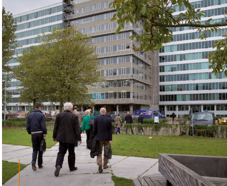
Noord-Holland • Door de transformatie heeft het voormalige GAK-kantoor in Amsterdam nu in totaal 651 appartementen, verdeeld over 11 woonlagen.