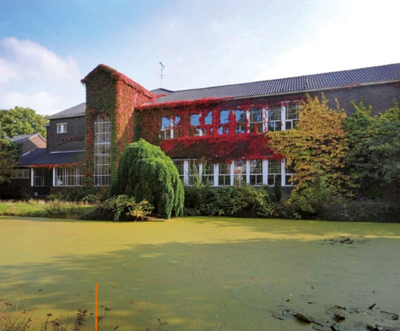
Gelderland • Het voormalig Stedelijk Gymnasium in Arnhem uit 1941 werd in 2014 gerenoveerd en herbestemd tot een hedendaags creatief woon- en werkcomplex.