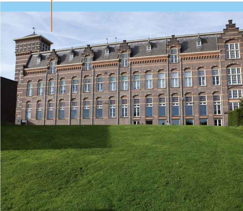
Bonnefanten College Maastricht

In 2015... is het Eiffelgebouw de 'X-factor' van de gebiedsontwikkeling. De gemeenteraad wil daar functies die Maastricht nog niet heeft en die de regio naar een hoger niveau kunnen tillen, zoals innovatie-ateliers voor wetenschappers en studenten, multifunctionele ontmoetingsruimten en flexwerkplekken. Dit alles in een vernieuwende mix van tijdelijke én permanente bestemmingen. Voor andere gebouwen zijn intentieovereenkomsten gesloten, voor onder meer studentenhuisvesting en verkoop aan het Centraal Orgaan Asielzoekerscentra.