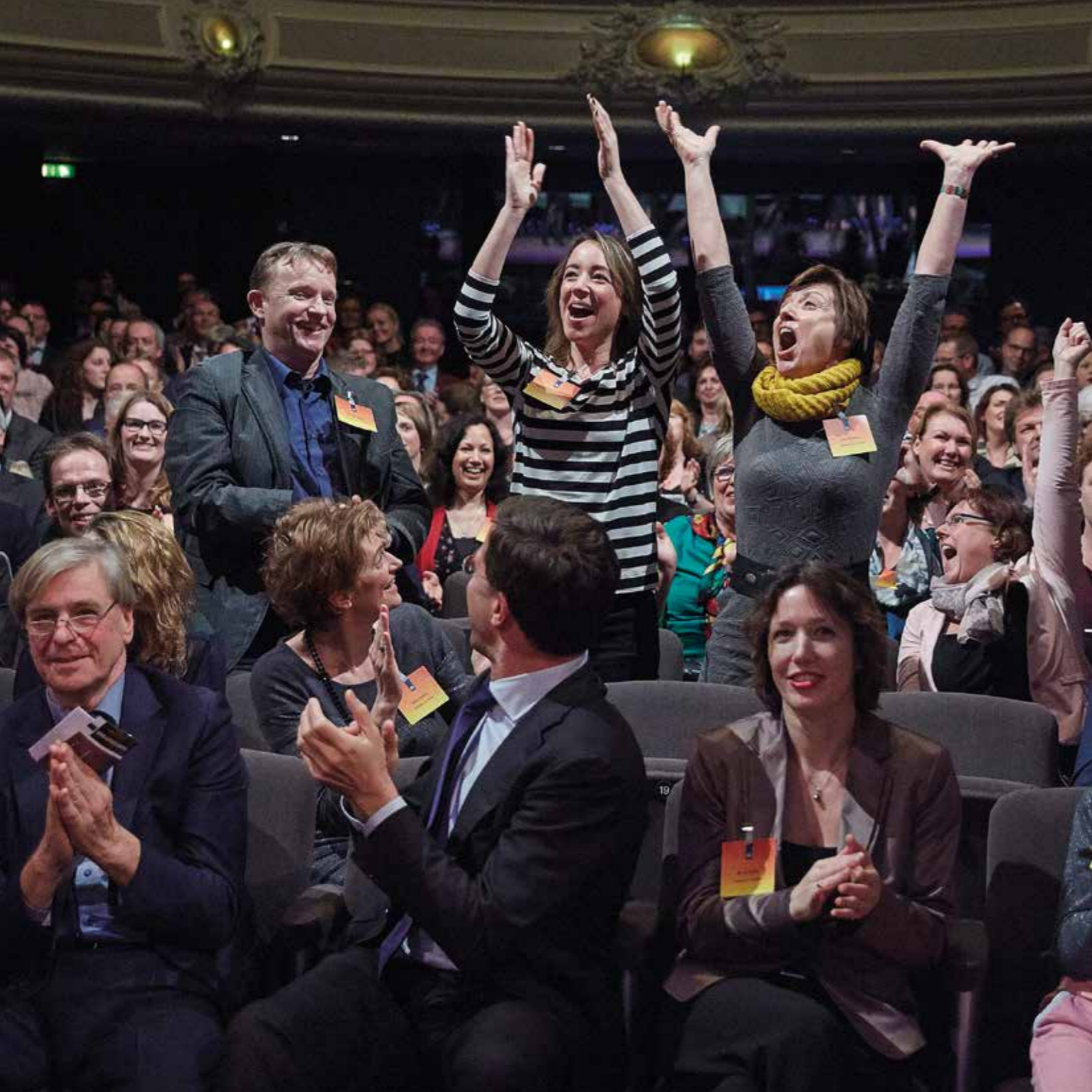
< Uitzinnige vreugde bij de bekendmaking van de Excellente Scholen 2014.