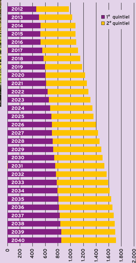
Figuur 3: Absolute aantallen 65+-huishoudens in het 1 e en 2 e quintiel (x1.000) (nulvariant)