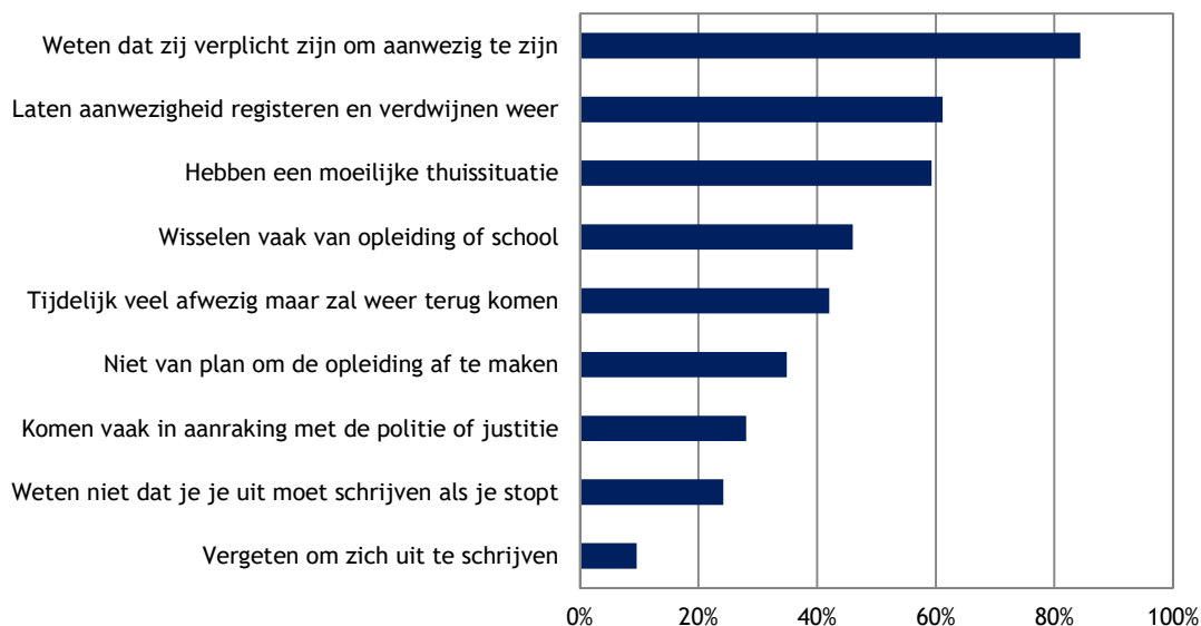
Figuur 3: Typering van personen die nooit of bijna nooit de lessen volgen (in %, N=171)

Naast mogelijke redenen voor verzuim is aan de respondenten gevraagd hoe zij personen met veel verzuim zouden karakteriseren. Uit de analyse blijkt dat studenten die veel verzuimen volgens 82 procent van hun studiegenoten wel op de hoogte zijn van hun aanwezigheidsplicht. Verder geeft 61 procent van de studenten aan dat er sprake is van calculerend gedrag in de zin dat studenten verschijnen om zich als aanwezig te laten registreren en vervolgens weer verdwijnen. Ook bij deze vraag wordt de moeilijke thuissituatie door de helft van de studenten genoemd als typerend voor deze groep. Bijna de helft van de studenten (46%) geeft verder aan dat deze studenten vaak switchen tussen opleidingen en instellingen (zie Figuur 3).