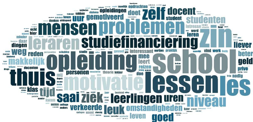
Figuur 4: Woordfrequenties van motieven om nooit of bijna nooit de lessen te volgen (N=171)