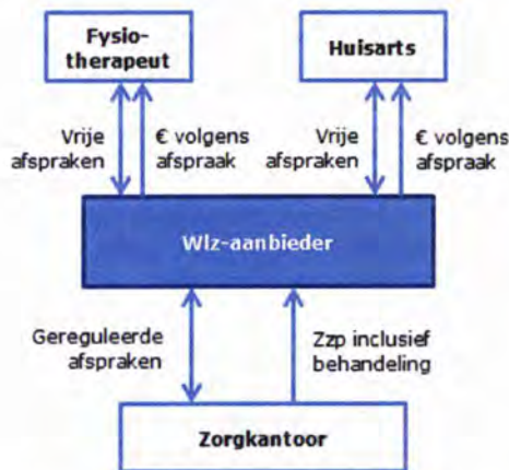
Figuur 3: Bekostigingsmodel 1

Invoering van bekostigingsmodel 1 heeft consequenties voor zowel zorgaanbieders, behandelaren, zorgkantoren als cliënt. Hieronder zetten we de belangrijkste consequenties op een rij.