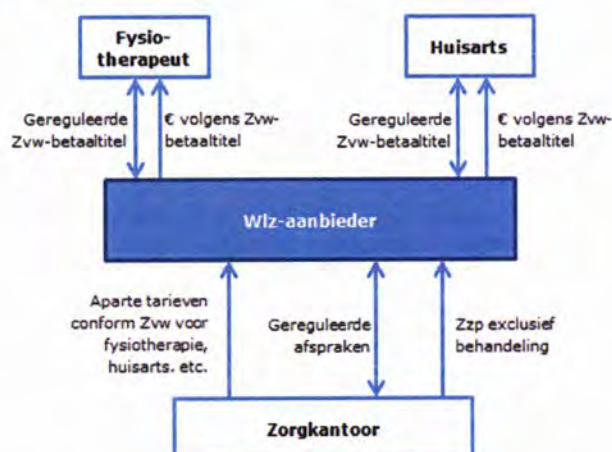
Figuur 5: Bekostigingsmodel 3

De voordelen van dit derde bekostigingsmodel ten opzichte van de eerste twee zijn: