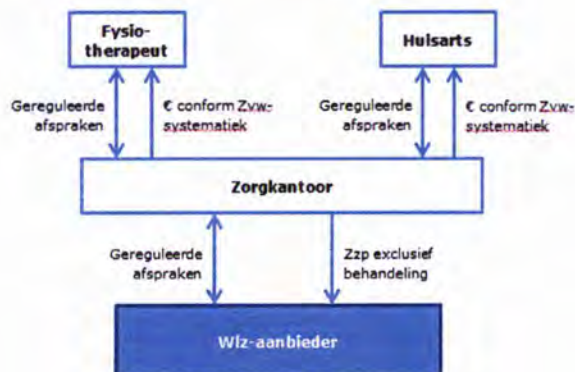
Figuur 6: Bekostigingsmodel 4

Ten opzichte van de vorige modellen zijn de voordelen van model 4: