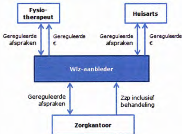
Figuur 4: Bekostigingsmodel 2

Ad 3: Prestaties exclusief behandeling. Aparte prestaties voor behandeling, declareren door de zorgaanbieder