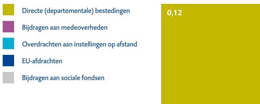
Figuur 1 Uitgaven Overige Hoge Colleges van Staat in 2018