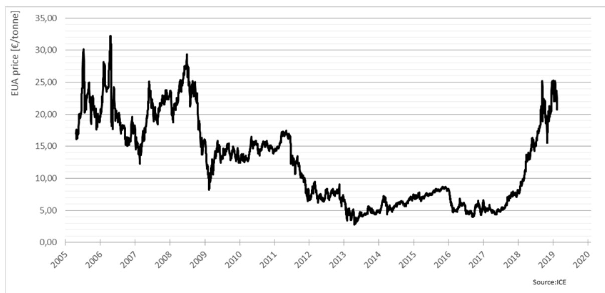
Figuur 4 - Ontwikkeling van de prijs van een ton CO 2 in het EU-ETS vanaf 2005