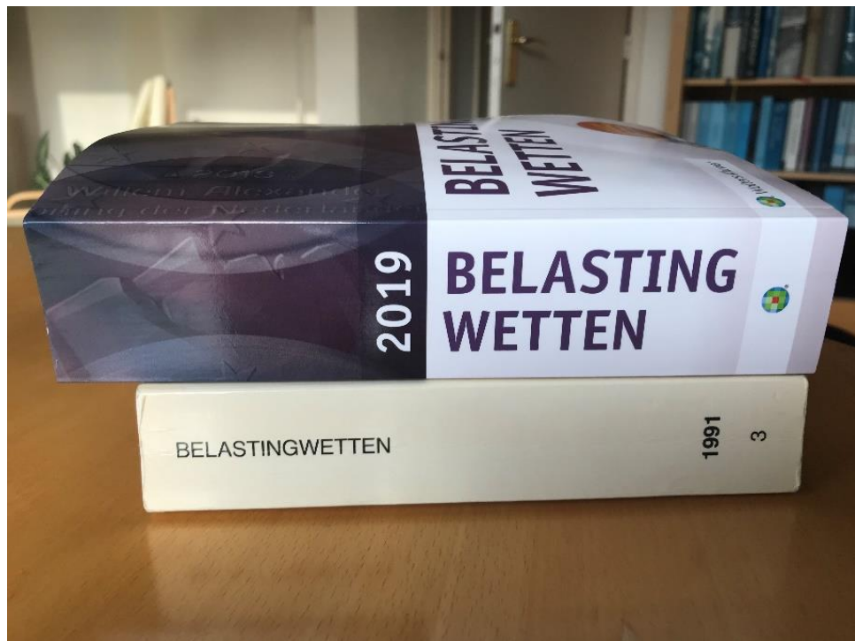
Van 789 bladzijden in 1991 naar 2.367 in 2019

Een voorbeeld hiervan is de in het Regeerakkoord Rutte III opgenomen halvering van het collegegeld. Deze halvering vereiste aanpassingen bij DUO, Studielink en de instellingen voor wat betreft de vaststelling van de hoogte van het collegegeld, maar daarnaast waren ook aanpassingen vereist binnen de studiefinanciering. Met de doorwerking van de verlaging van het collegegeld in het domein studiefinanciering werd echter bij de totstandkoming van het Regeerakkoord geen rekening gehouden. De oriëntatie op nieuw beleid is dominant waardoor de ervaring is dat er meer regelingen bijkomen dan er worden afgeschaft.