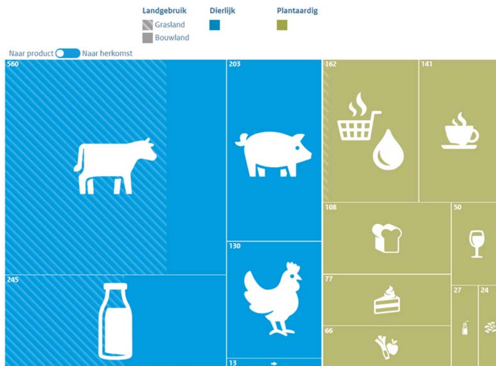
Figuur 1: Indicatieve geografische verdeling landvoetafdruk van de Nederlandse voedselconsumptie. 36

bedraagt: een kwart voetbalveld. Het grootste deel komt voor rekening van de consumptie van dierlijke producten (vlees en zuivel), zoals figuur 1 laat zien.