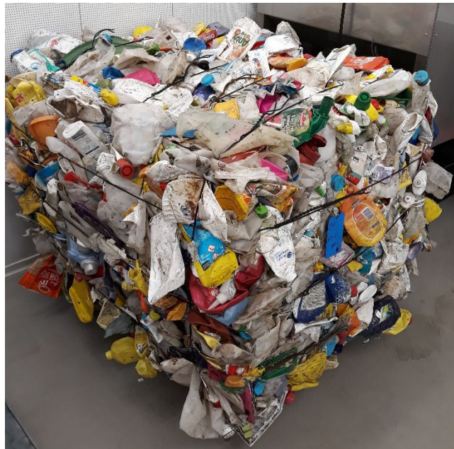
Figuur 2 Foto van het sorteerproduct: een PE sorteerbaal, output van een sorteerbedrijf

Figuur 2 toont ter illustratie een foto van het sorteerproduct (baal plastic als output van sorteerbedrijf) en figuur 3 toont een aantal foto's van gewassen maaggoed.