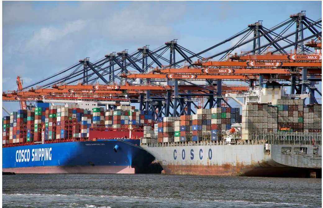
Foto: Het grijze containerschip heeft een stapelhoogte tot 6 containers boven de loopbruggen.

Op een aantal gecontroleerde grote schepen zijn de containerstapels zo hoog dat de bovenste lagen alleen met twist-locks vastgezet kunnen worden. Twist-locks verbinden de hoeken van op elkaar gestapelde containers. Het gebruik van twist-locks op de hoogst gestapelde containers is in overeenstemming met het CSM. Het risico is wel dat verbindingen met uitsluitend twist-locks kunnen afbreken onder