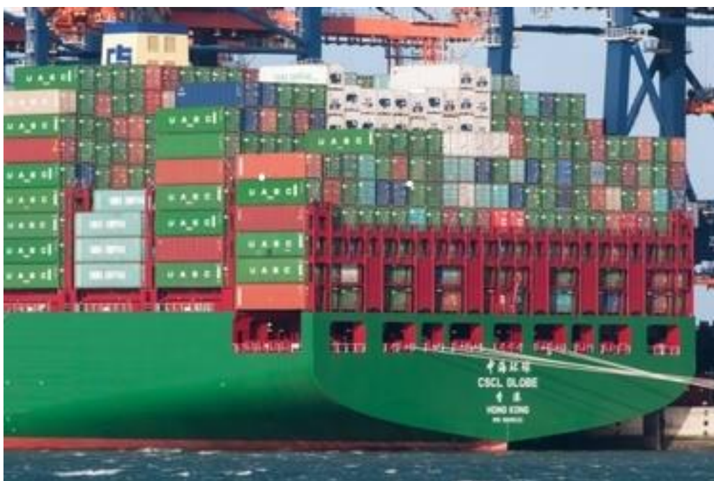
Foto: Alleen de containers direct boven de loopbruggen zijn gesjord met sjorstangen.

Op 12 schepen werkte de bemanning samen met een sjorbedrijf bij het sjorren van de lading. Op 41 schepen sjort een sjorbedrijf de lading. Omdat sjorren specialistisch en fysiek zwaar werk is, is het de vraag of de bemanning belast moet worden met dit werk. Vooral op de Europese containerdiensten krijgen bemanningen dan misschien niet voldoende rust. Dit komt doordat de schepen regelmatig havens bezoeken.