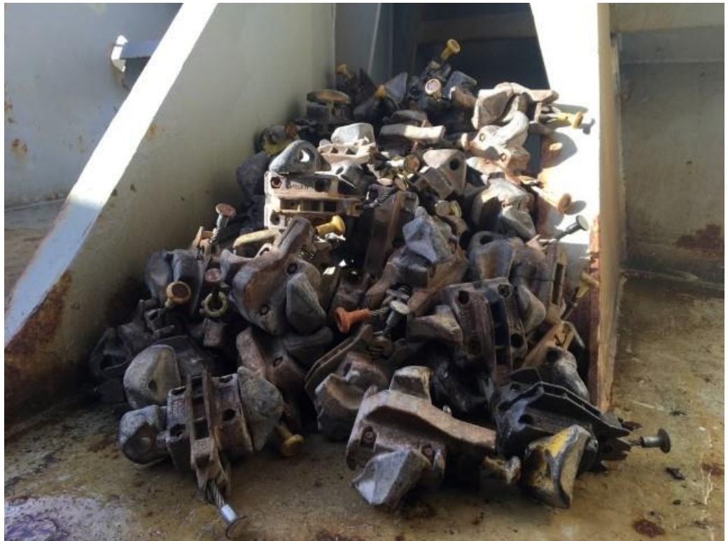
Foto: Tijdelijke opslag van twist-locks op een schip (bron: ILT).

Sinds de IMO per 1 juli 2016 regels invoerde voor de VGM van containers, is er meer zekerheid over het gewicht van containers. De verlader is sindsdien verantwoordelijk voor het opgegeven gewicht. Voor nog grotere zekerheid over het gewicht, is het wegen van de container op de terminal een mogelijkheid. Bij de inspecties bleek dat de bemanning aan boord soms ook containers laden waarvan zij de gewichten niet kennen.