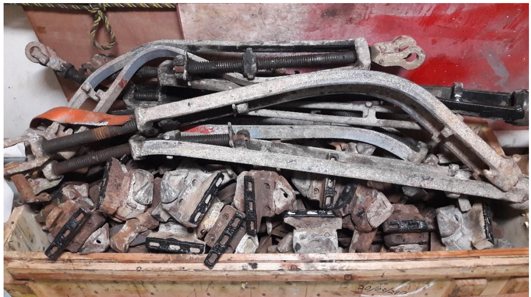
Foto: Beschadigde spanschroefverbindingen op een schip.

Zo zijn containerschepen door hun vorm gevoelig voor bijvoorbeeld parametrisch slingeren. De slingerhoek kan hierdoor bij sterke wind en hoge golven plotseling tot boven 38 graden toenemen. Bij zulke omstandigheden worden de krachten op de containers aan dek groot. Zelfs zo groot dat containers van het schip in zee kunnen vallen, ook al heeft het sjorbedrijf gesjord volgens het CSM.