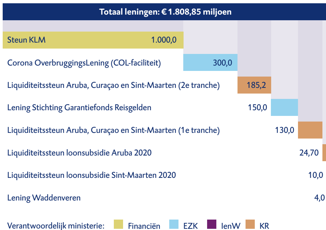
Figuur 3 Overzicht leningen coronacrisis