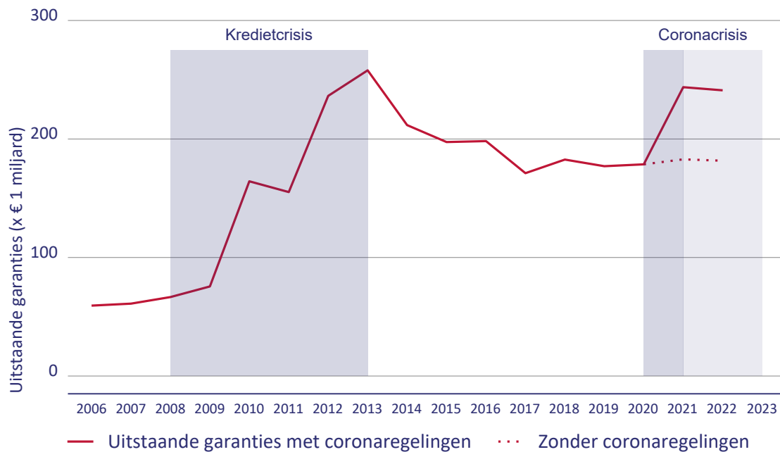
Figuur 4 Ontwikkeling garantieverplichtingen van het Rijk (2006-2022)

Het kabinet verwacht dat eind 2020 het bedrag aan uitstaande garanties weer sterk zal toenemen tot € 243,7 miljard. De stijging van € 65,1 miljard ten opzichte van 2019, is voor € 60,9 miljard het directe gevolg van de maatregelen die zijn getroffen om de gevolgen van de coronacrisis op te vangen. Zonder deze maatregelen zou het uitstaande risico zijn toegenomen met € 4,2 miljard tot € 182,8 miljard. Als gevolg van de verstrekte leningen nemen de risico's voor de overheidsfinanciën door de coronacrisis in totaal toe met € 62,7 miljard tot € 245,5 miljard. Met deze stijging bevinden de uitstaande risico's zich, door de risicoregelingen die zijn geïntroduceerd of verruimd om de financieel-economische gevolgen van de coronacrisis op te vangen, weer bijna op het hoogste niveau uit de periode van de kredietcrisis.