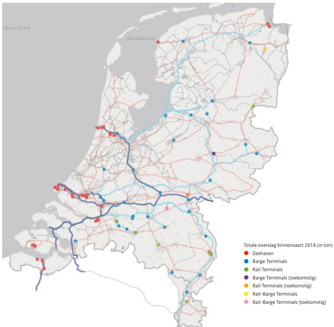
Figuur 3: Containerterminals in Nederland (voor derden toegankelijk) 38