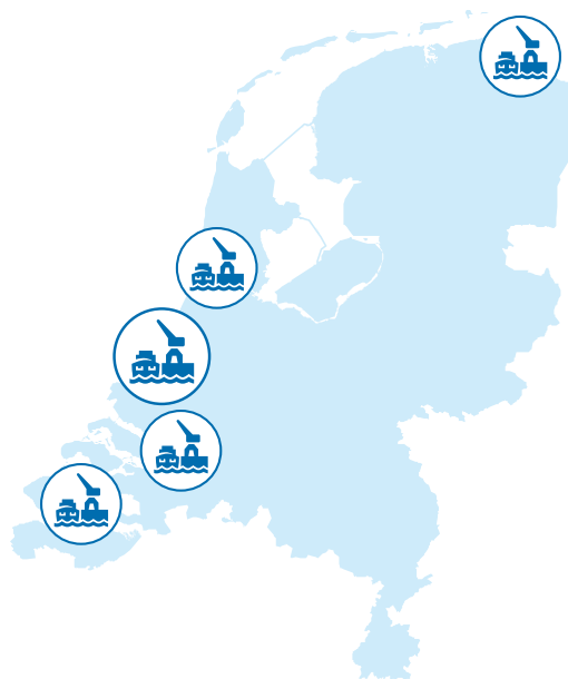
Figuur 1: Havens van nationaal belang

Het Ministerie van IenW gaat in deze Havennota uit van vijf havens van nationaal belang die in het Meerjarenprogramma Infrastructuur, Ruimte en Transport (MIRT) prioriteit hebben. 15 Het nationale belang wordt bepaald op basis van de op- en overslag van goederen en de bijdrage aan de nationale economie en werkgelegenheid. Dit zijn Rotterdam, Moerdijk, Amsterdam/Noordzeekanaalgebied, Groningen (Eemshaven en Delfzijl) en North Sea Port (in Nederland: Vlissingen en Terneuzen). De Rijksoverheid wil deze havens als een geïntegreerd systeem beschouwen om hun economische betekenis voor Nederland toekomstgericht te kunnen versterken.