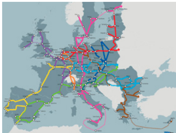
Figuur 4: TEN-T corridors. 45

De Europese Green Deal zoals de Europese Commissie deze in december 2019 presenteerde zet ook nadrukkelijk in op het stimuleren van modal shift naar water en spoor. Het Motorways of the Seas beleid van de EU draagt tot slot bij aan het versterken van de Europese kustvaart. Dit is positief voor de spilfunctie (hub and spoke) van de Nederlandse havens en bevordert duurzaam transport over zee door een lagere uitstoot per eenheid product in vergelijking met andere modaliteiten.