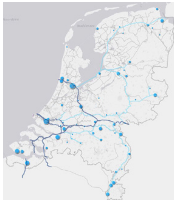
Figuur 2: Totale binnenvaartoverslag havens 34

Totale overslag binnenvaart 2018 (in ton)