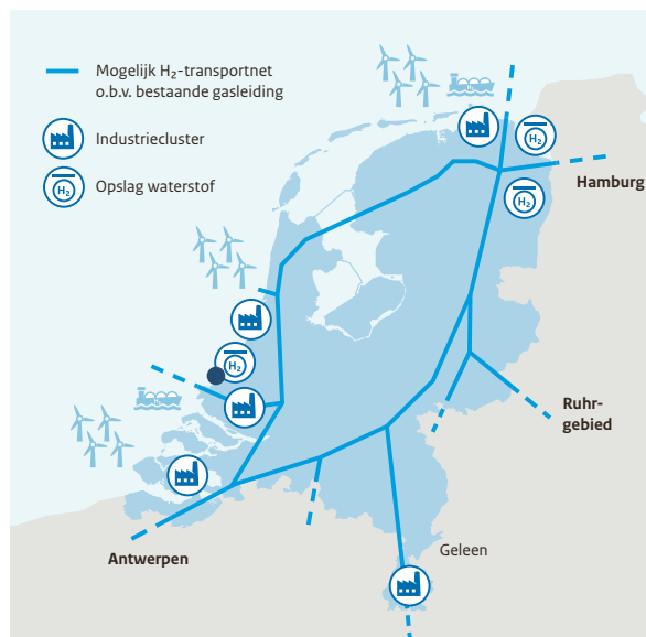
Figuur 5: Mogelijkheden waterstof transportnetwerk

‘licence to operate’ behouden en duurzame havens een marktfactor van belang worden in de concurrentiestrijd om logistieke ketens en vervoersstromen aan te trekken. Van belang is daarbij ook dat havens en de goederencorridors binnen de beschikbare milieuruimte (kunnen) opereren. Dit vergt inspanning van alle betrokken partijen. Daarnaast vervullen de havenbedrijven een rol bij het investeren in en het bewaken van de kwaliteit van de leefomgeving.