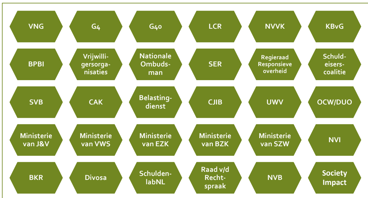
Figuur 2.2 Betrokken partijen in het Samenwerkingsverband Brede Schuldenaanpak

In dit samenwerkingsverband ontmoeten ministeries, gemeenten en andere soorten organisaties elkaar, waarbij zij elkaar informeren over verschillende initiatieven met betrekking tot de