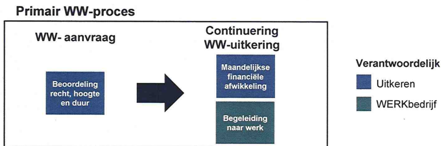
Figuur 1: Primair WW-proces

In de afgelopen jaren is het WW-proces van UWV sterk gewijzigd door digitalisering die onder andere is ingegeven door bezuinigingen, evenals door de beperking van de toets op verwijtbare werkloosheid middels een wetswijziging in 2006. Het WW-proces is voor uitkeringsgerechtigden inmiddels grotendeels digitaal. 97% van de WW-aanvragen gebeurt digitaal. Resultante hiervan is dat er minder persoonlijk contact is met de aanvragers van een WW-uitkering. In opzet is het WW-proces hierdoor anoniemer geworden. De mogelijkheden voor het gebruik van data-analyse en tooling in het WW-proces zijn toegenomen als gevolg van de digitalisering.