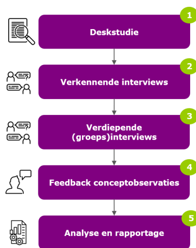
Figuur 1. Onderzoeksproces

Om invulling te geven aan de opzet van een lerende evaluatie is gebruik gemaakt van vier dataverzamelmethode: deskstudie, verkennende interviews, verdiepende (groeps)interviews en (schriftelijke) feedback op conceptobservaties (zie Figuur 1). De deskstudie had als doel om een globaal overzicht te krijgen van het Versnellingsplan. Hiervoor zijn diverse documenten bestudeerd, waaronder jaarplannen, jaarverslagen, visiedocumenten, voortgangsrapportages, verantwoordingsdocumenten, de oorspronkelijke Versnellingsagenda en het initiële Versnellingsplan uit 2018. De deskstudie diende tevens als input voor het interviewprotocol. Vervolgens zijn een reeks verkennende interviews gehouden met het programmateam, de stuurgroep en enkele hoger onderwijs (ho) instellingen binnen en buiten het Versnellingsplan om meer inzicht te krijgen in wat het Versnellingsplan als geheel in de praktijk teweegbrengt en de procesmatige werking van de verschillende teams en zones. De interviews zijn ook gebruikt om de bevindingen uit de deskstudie aan te vullen. Hierna zijn een reeks verdiepende (groeps)interviews gehouden met de kernteams (aanvoerders en verbinders) van de zones en werkgroepen en de zoneleden. Het doel hiervan was het in kaart brengen van de werking van de verschillende zones alsook het ophalen van de ervaringen vanuit de individuele zones (en werkgroepen). In totaal zijn 85 personen gesproken in de beide interviewrondes (zie Bijlage 1).