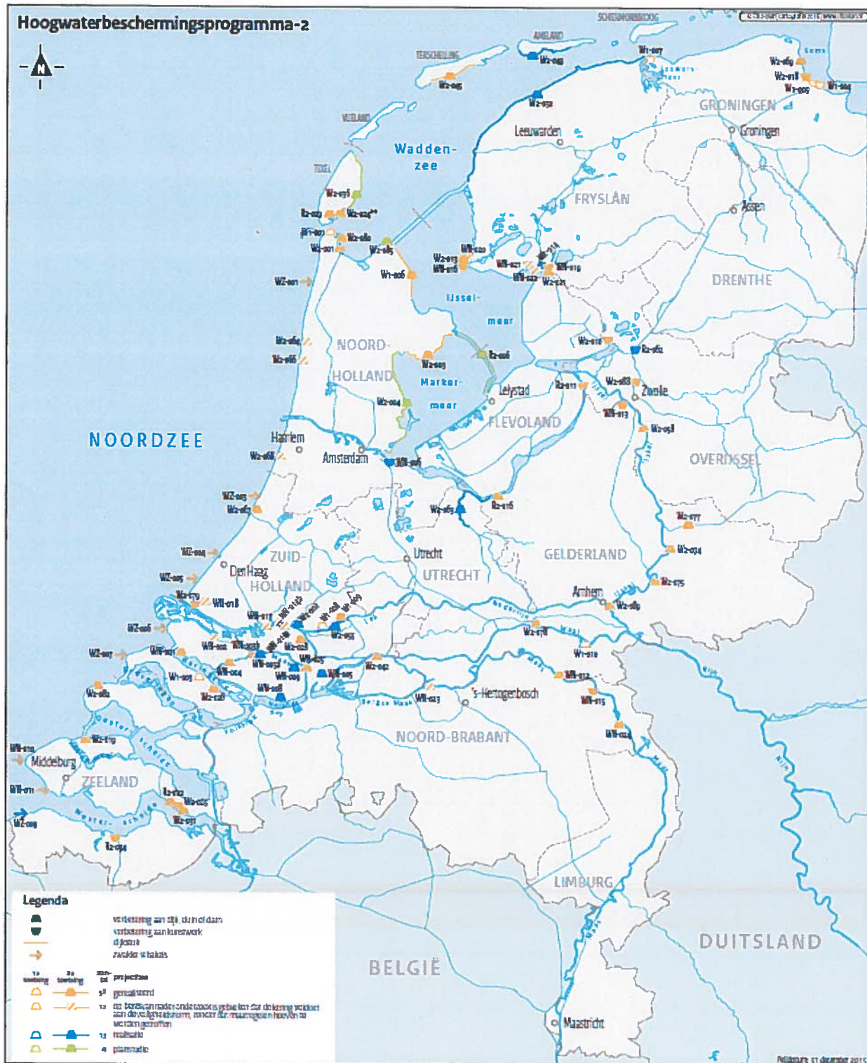
Figuur 2 Actuele scope van het programma, peildatum 31 december 2015