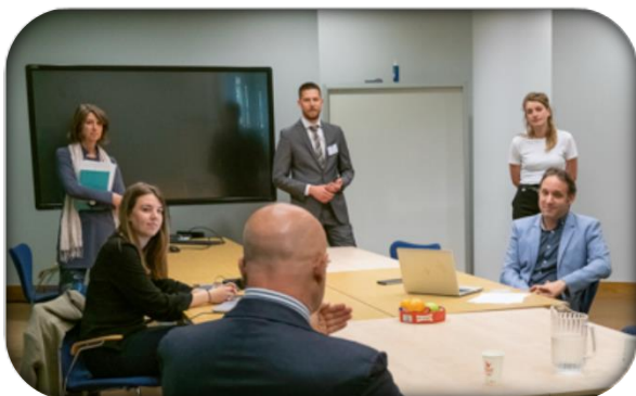
Toelichting foto: in gesprek over de eerste leerpunten.

Het kernteam (NCTV/NCSC/COT/Fox-IT) had wekelijkse - soms dagelijkse - afstemmingsmomenten. Maandelijks was er afstemming met de stuurgroep. De kerngroep stelde het technische en het generieke scenario samen en was verantwoordelijk voor het draaiboek, het evaluatiekader, de inhoud van de briefingsmomenten, de evaluatiedag, de bestuurlijke sessie en de ICCb-oefening. De communicatie in de oefening werd geregisseerd door het Nationaal Kernteam Crisiscommunicatie (NKC). De communicatie over de oefening kwam vanuit de communicatieteams van het NCSC en de NCTV. De deelnemers werden door nieuwsbrieven op de hoogte gehouden van het proces en kregen documenten toegestuurd via een afgeschermd portal.