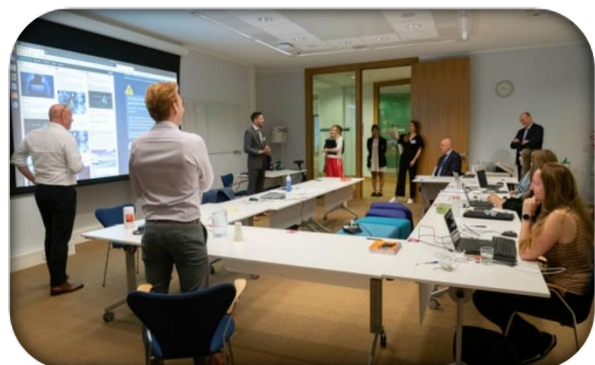
Toelichting foto: koers bepalen in de algemene responscel.