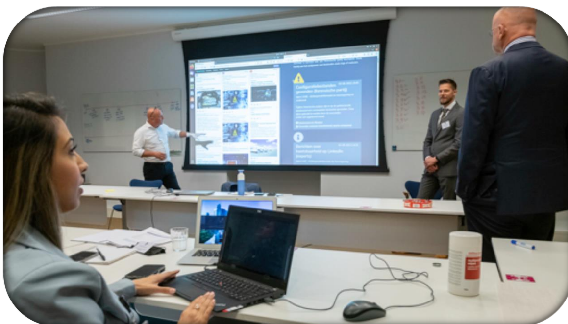
Toelichting foto: de centrale oefenleiding toont minister Grapperhaus de online media- en technische oefenomgeving.