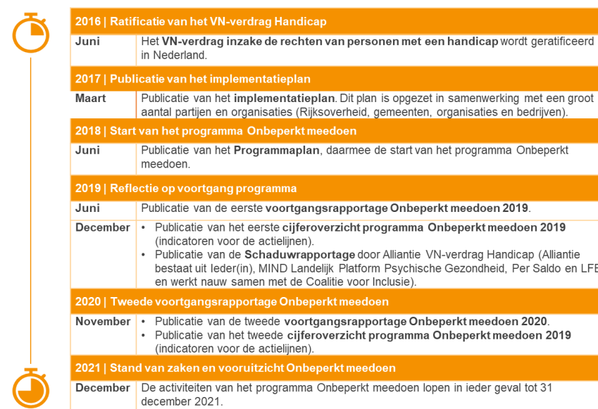
Figuur 1. Tijdlijn van documentatie over programma Onbeperkt meedoen!

Figuur 1 bevat een tijdlijn met verwijzingen naar relevante documentatie over het programma Onbeperkt meedoen! vanaf de ratificatie van het VN-verdrag in 2016, de start van het programma in 2018 tot en met de huidige situatie in 2021.