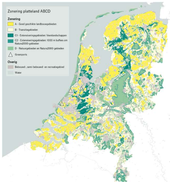
Figuur 1: Gebiedsindeling in kaart gebracht. (Bron: LNV (bewerking door LNV van Bakker et al., 2021)).

De kaart in Figuur 1 is een afgeleide van de kaart van Bakker et al. (2021), en onderscheidt de gebieden op basis van een reeks ruimtelijke criteria (zie tekstbox 1 voor meer details). Globaal kan bij deze tentatieve gebiedsindeling aan de volgende arealen cultuurgrond worden gedacht: zone A ca. 845.000 ha ( \approx 40\% van huidig totale cultuurareaal), zone B ca. 735.000 ha ( \approx 40\% ), zone C ca. 420.000 ha ( \approx 20\% ).