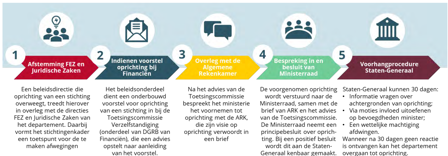
Figuur 1 - Procedure voor oprichting overheidsstichting zoals neergelegd in het Stichtingenkader

Het stichtingenkader bevat, behalve inhoudelijke afwegingen rondom de mogelijke oprichting van overheidsstichtingen, ook de procedure die beleidsdirecties moeten volgen die oprichting van een stichting overwegen. De figuur hieronder bevat een schematische weergave van deze procedure.