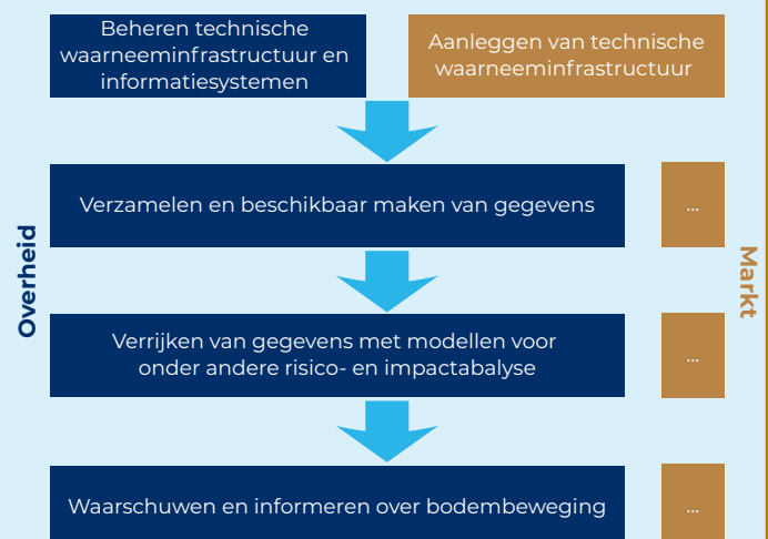
Figuur 3. Versimpelde weergave van de waardeketen in de seismologische sector.

Op basis hiervan waarschuwt en informeert het KNMI het algemene publiek over bodembeweging. Er zijn amper marktpartijen die op basis van de gegevens diensten aanbieden. De diensten die aangeboden worden gaan over risicoanalyses of impactanalyses. Zowel markt als overheid hebben hier een rol in.