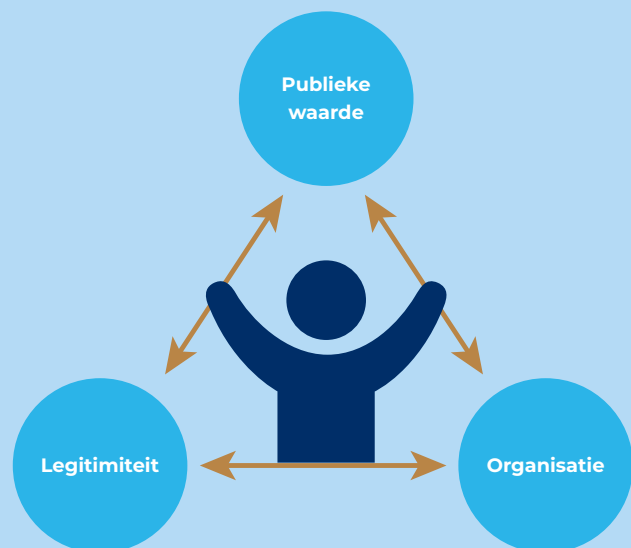
Figuur 1. Publieke waarde-model.