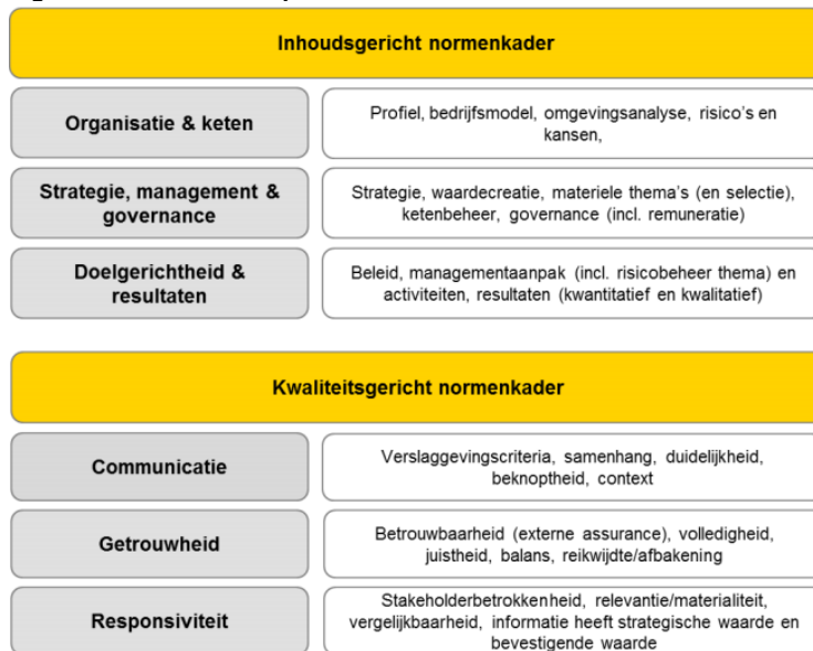
Figuur 2.3 Criteria Transparantiebenchmark 2021

In 2014 en 2019 zijn de criteria herzien. In 2014 is naar aanleiding van de evaluatie besloten meer aandacht te besteden aan de sectorspecificiteit en iMVO-prestaties. Ook hebben waarde-creatie en materialiteit een meer prominente plek gekregen. Daarnaast is meer aandacht besteed aan de implementatie van de OESO-richtlijnen voor multinationale ondernemingen. 22