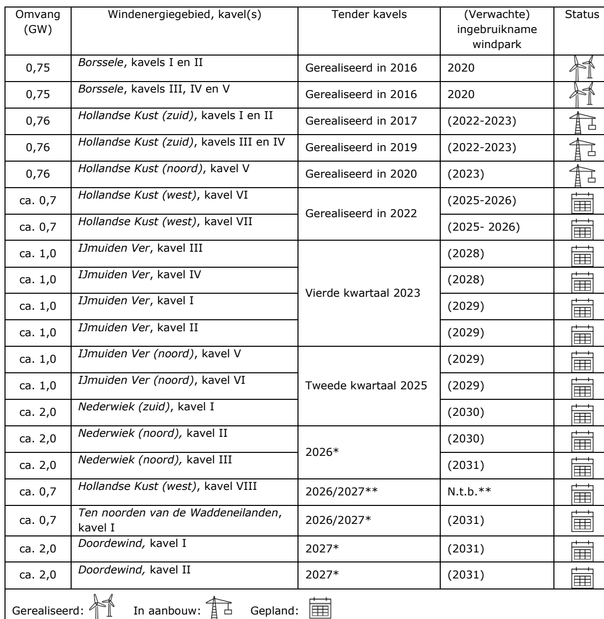
Tabel 1 Volgorde van ontwikkeling windenergie op zee

* De tenderdata voor deze windenergiegebieden zijn indicatief. Naar verwachting zal in 2024 over de planning een definitief besluit worden genomen, op basis van de resultaten van het onderzoeksprogramma Programma Aansluiting Wind op Zee – Eemshaven (PAWOZ - Eemshaven) voor Ten noorden van de Waddeneilanden en Doordewind , en het onderzoek naar aanlanding voor kavel III van Nederwiek . Dan is duidelijk welke kavels voor de 10,7 GW van de aanvullende routekaart worden benut en welke onbenutte (kavels van) windenergiegebieden kunnen doorschuiven naar de opgave voor windenergie op zee na 2031.