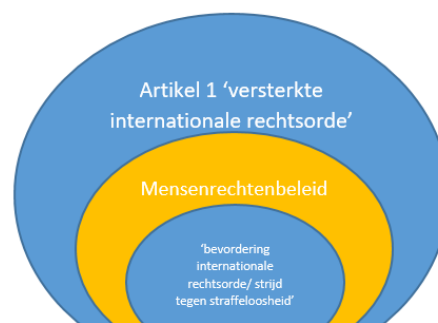
Figuur 1. visueel schema van relatie mensenrechtenbeleid en internationale rechtsorde

mensenrechtenbeleid werd in de jaarlijkse Mensenrechtenrapportage tot en met 2020 benoemd als 'bevordering internationale rechtsorde/strijd tegen straffeloosheid'. 90 In 2021 werd een intern resultatenkader opgesteld voor het mensenrechtenbeleid, waarbij 'international accountability for the most serious crimes' de zesde prioriteit is. 91 Dit impliceert dat het bevorderen van de internationale rechtsorde wordt gezien als bijkomende zaak van het mensenrechtenbeleid (en dus niet op zichzelf staat). De manier waarop 'bevordering internationale rechtsorde' is ingekaderd, en het door elkaar gebruiken van verschillende termen/het gebruiken van termen met dubbele betekenissen, dragen niet positief bij aan het ontwikkelen van helder beleid. Ook in de recente beleidsbrief Buitenlandse Zaken lijkt de internationale rechtsorde gezien te worden als een onderdeel van het mensenrechtenbeleid en beperkt te worden tot de strijd tegen straffeloosheid. 92 Daardoor wordt de grondwettelijke verplichting, de bevordering van de ontwikkeling van de internationale rechtsorde, beperkt uitgelegd. Naast het bestrijden van straffeloosheid wordt de ontwikkeling van de internationale rechtsorde bijvoorbeeld ook bevorderd door het ontwikkelen van nieuwe rechtsgebieden, of door in te zetten op het bevorderen van sociale rechten en de bescherming van de positie van werknemers. 93