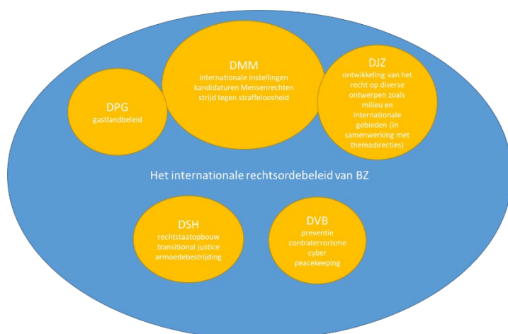
Figuur 2. Overzicht van de verdeling van de internationale rechtsordebeleidsterreinen over de betrokken directies

In de kabinetsreactie op de vorige IOB-evaluatie werd aangegeven dat de bevordering van de ontwikkeling van de internationale rechtsorde ‘als een rode draad door het Nederlandse buitenlandbeleid loopt.’ 98 Figuur 2 geeft een schematisch overzicht van de belangrijkste uitvoerders van het ‘internationale rechtsordebeleid’ van BZ. Elke gele bol representeert een BZ-directie; de inzet van regiodirecties wordt hierbij niet meegenomen. De directie Multilaterale Instellingen en Mensenrechten (DMM) is als budgethouder van artikel 1 ‘Versterkte internationale rechtsorde’ de coördinerende directie op dit terrein, maar zoals figuur 2 zichtbaar maakt, valt er meer inzet onder ‘het internationale rechtsordebeleid’ dan dat wat onder de verantwoordelijkheid (en coördinatie) van DMM valt. Uit dit schema blijkt ook dat naast DJZ zowel directies van de DGPZ-kant (Directie Veiligheidsbeleid (DVB)) als de DGIS-kant (Directie Stabiliteit en Humanitaire Hulp (DSH)) van BZ een bijdrage leveren aan de internationale rechtsorde.