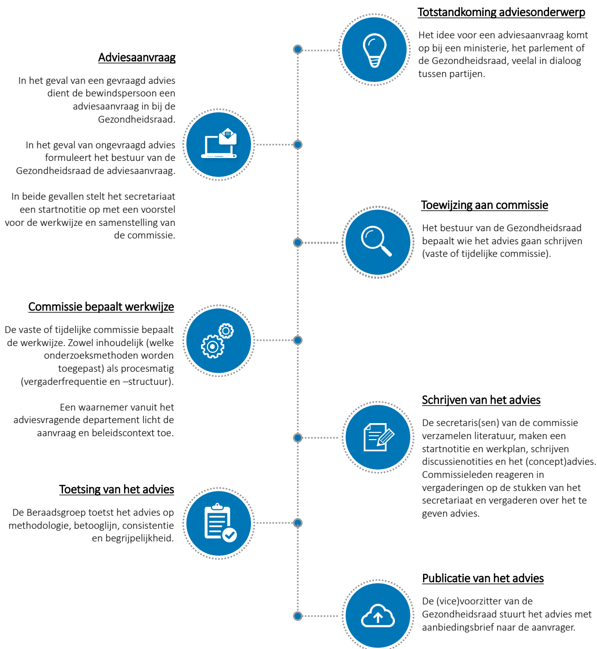
Figuur 1. Schematische weergave adviestrajecten Gezondheidsraad. NB: dit is een vereenvoudigde weergave.

In deze paragraaf gaan wij in op de totstandkoming van de adviezen van de Gezondheidsraad. We gaan in op de verschillende onderdelen van het adviestraject, van de aanvraag (of het besluit tot het uitbrengen van een ongevraagd advies) tot de publicatie. Onderstaand figuur geeft een vereenvoudigde weergave van de verschillende stappen in het proces.