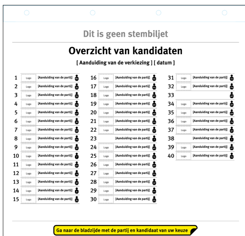
Schets van voorzijde van het overzicht van kandidaten

De namen en de nummers van de kandidaten kan de kiezer terugvinden in het Overzicht van kandidaten dat de kiezer voor de verkiezingsdag thuis krijgt, en dat tevens voor de kiezer in het stembokje beschikbaar is. In dat overzicht staan ook de overige gegevens van de kandidaten die op het huidige stembiljet staan, te weten voorletter(s), (eventuele) roepnaam, gemeente of woonplaats en eventueel geslacht. Verder staat op het overzicht, evenals op het stembiljet, bij elke partij het aantal kandidaten vermeld dat op de lijst staat. 15 De kiezer raadpleegt het Overzicht van kandidaten om na te gaan welk kandidaatsnummer hoort bij de kandidaat op wie hij wil stemmen. Hieronder staan twee schetsen afgebeeld van het Overzicht van kandidaten: een schets van de voorzijde van het Overzicht van kandidaten en een schets van een willekeurige pagina van een partij (hier: pagina 4, partij 4). Bij ministeriële regeling wordt een model voor dit overzicht van kandidaten vastgesteld.