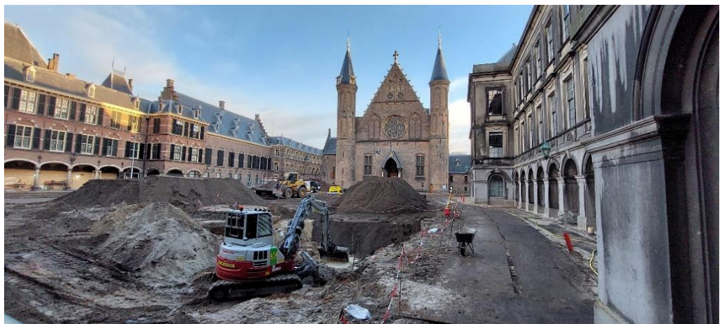
Werkzaamheden Opperhof, foto RVB

In de achtste voortgangsrapportage werd ingegaan op het starten van het ruimen van de kabels en leidingen op het Opperhof. Deze zijn in de tweede helft van 2022 geschoond of weggehaald. Tijdens deze werkzaamheden werd, in samenwerking met de gemeente Den Haag, archeologisch onderzoek verricht. De diverse vondsten geven de dienst archeologie van de gemeente Den Haag meer kennis over het verleden van het Binnenhof.