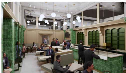
Artist Impression Statencafe, Berns en de Architecten Cie