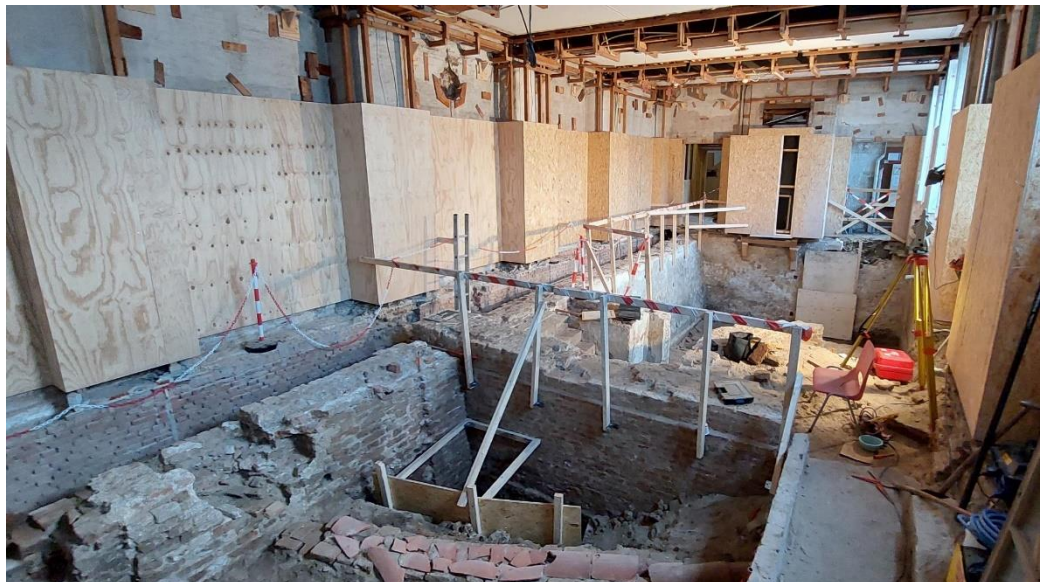
Kademuur in de Volle Raadzaal

In oktober 2022 zijn onder de voormalige Volle Raadzaal een kademuur (13 e /14 e eeuw) en een kelder (16 e /17 e eeuw) aangetroffen. De archeologische vondst maakt onderdeel uit van de onderzoeksfase van de renovatie. In een eerder stadium is het risico onderkend dat er meer oude restanten in de bodem aanwezig zijn dan wat op basis van beschikbare documentatie en oude tekeningen terug te vinden is. Daarom wordt er tijdens de onderzoeksfase in samenwerking met de Gemeente Den Haag archeologisch onderzoek uitgevoerd in en rond de huisvesting van Raad van State op het Binnenhof.