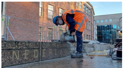
Loszagen van de grondwetbank