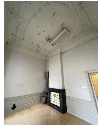
Historische plafonds in de TK

In het complex is het demonteren van (systeem) plafonds in volle gang. Hierbij zijn historische plafonds ontdekt. Op dit moment overleggen het RCE, monumentenzorg en het ontwerpteam over hoe, in het licht van de renovatiewerkzaamheden, het beste met deze vondsten kan worden omgegaan en of dit een impact heeft op de ontwerpen. Vanaf de zomer 2022 is er gestart met de uitvoeringswerkzaamheden voor de energievoorziening tijdens de bouw. Deze energievoorziening zal ook voor de definitieve situatie worden ingezet.