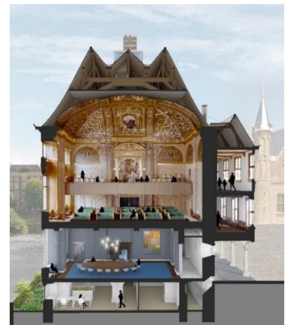
Impressie renovatie Eerste Kamer, BiermanHenket

Voorafgaand aan de start van de uitvoeringsfase die voor het gebouwdeel Eerste Kamer is voorzien vanaf 2025 moet de huidige staat van het pand goed zijn geanalyseerd. Om de exacte staat van onder meer vloeren en wanden te kunnen bepalen zijn afgelopen periode tientallen kleine gaten geboord om de opbouw van wanden en vloeren en daarmee ook de stevigheid van de constructie in kaart gebracht. Dit alles gebeurt zorgvuldig in overleg met bouwhistorici.