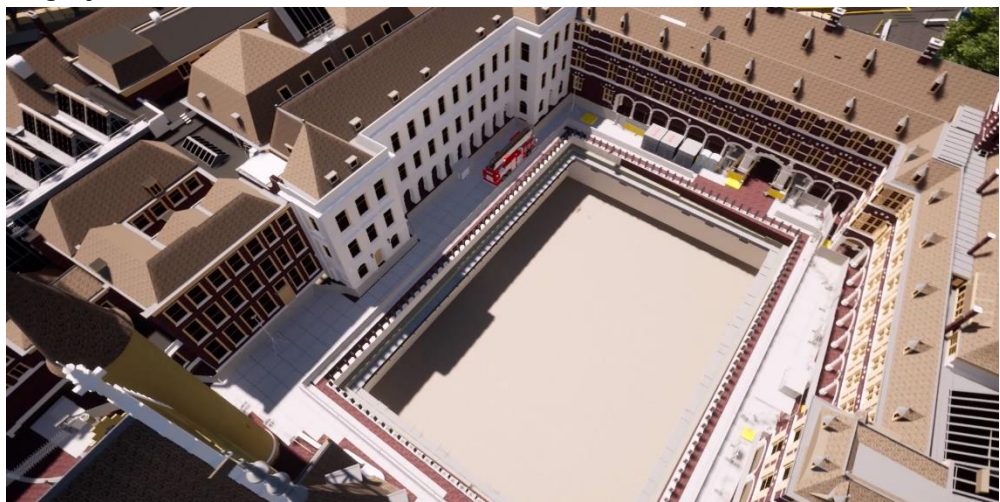
Impressie contouren technische hoofdinfrastructuur

Het realiseren van de THI is voorwaardelijk voor de oplevering van de gebouwdelen, omdat deze pas daarna kunnen worden aangesloten op de centrale energie- en veiligheidsvoorzieningen. Daarnaast hebben deze graafwerkzaamheden die niet met elektrisch materiaal kunnen worden uitgevoerd, stikstofuitstoot tot gevolg. Dit betekent dat andere werkzaamheden die ook stikstofuitstoot met zich meebrengen op een later moment plaatsvinden en niet meer gelijktijdig met de werkzaamheden voor de THI kunnen plaatsvinden. Bij de uitvoering komt dat, waar eerder het gelijktijdig uitvoeren van werkzaamheden een mogelijkheid bood om op schema te blijven, de beschikbare ruimte in en om het Binnenhof door onder meer het grote ruimtebeslag van de THI, beperkingen met zich meebrengt. Grote werkzaamheden kunnen niet gelijktijdig uitgevoerd worden en moeten volgtijdelijk plaatsvinden. Er zijn daarom geen verdere maatregelen meer te treffen om deze vertraging in te lopen. Deze toename van eisen en het ruimtegebrek zorgen voor een vertraging van circa 15 maanden. Zoals aangegeven in de achtste voortgangsrapportage is als beheersmaatregel de opdrachtverlening van de ruwbouw van de technische ruimte vervroegd. De splitsing van ruwbouw en de installaties en ringleidingen maakt dit mogelijk.