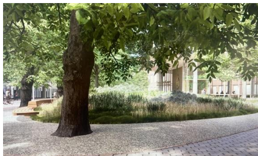
Artist Impression Ontwerp Publieksentree TK, De Architecten Cie & Karres en Brands Publieksentree