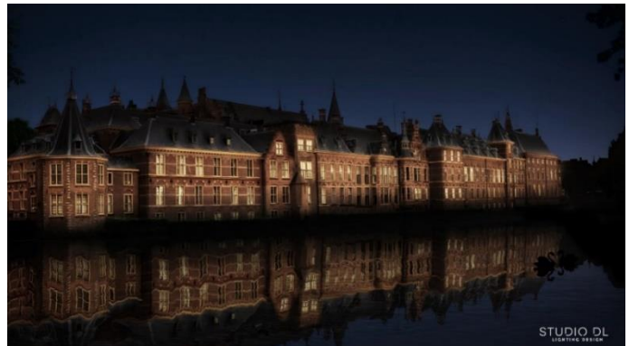
Impressie Aanlichting Hofvijverzijde Definitief Ontwerp, Studio DL Lighting Design