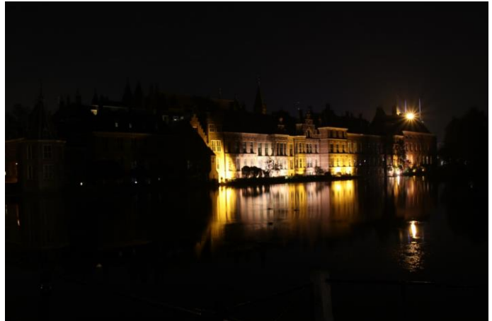
Huidige aanlichting Hofvijverzijde

De buitenverlichting van de complexdelen is zeer verouderd en niet duurzaam. Vervanging is daarom noodzakelijk. In de rapportageperiode zijn de plannen voor de buitenverlichting en de aanlichting van de Hofvijverzijde afgerond. In overleg met de gemeente is ervoor gekozen om de buitenverlichting van het Binnenhofcomplex aan te laten sluiten bij de reeds vervangen buitenverlichting van andere gebouwen in de directe omgeving, het Museumkwartier. De vergunning voor het aanlichten van de Hofvijverzijde van het Binnenhofcomplex wordt op korte termijn aangevraagd. De realisatie van de buitenverlichting aan de Hofvijverzijde van het complex zal zo spoedig mogelijk na toekenning van de vergunning plaatsvinden om bij te dragen aan een zo aantrekkelijk mogelijk beeld op het Binnenhof voor bezoekers van de Haagse binnenstad.