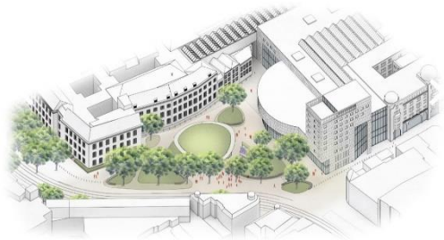
Artist Impression Ontwerp Publieksentree TK, De Architecten Cie & Karres en Brands Publieksentree