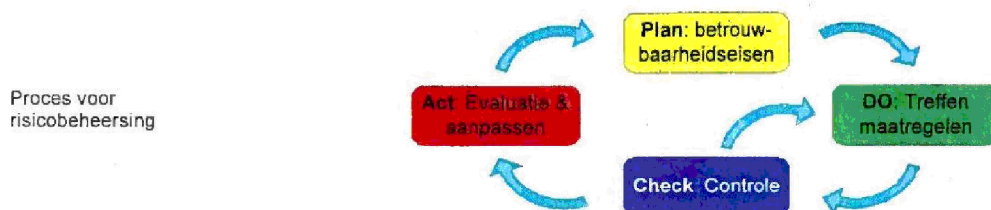
Figuur 3: Beheersingscyclus

Het VIR geeft de beveiligingsbeheersingscyclus op deze wijze weer: