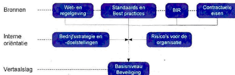
Figuur 1: Afleiden basisniveau beveiliging

Voor zover beveiligingsrisico's algemeen van aard zijn, d.w.z. niet specifiek zijn voor de Belastingdienst, spelen de standaarden en best practices die mede als referentie gelden voor dit handboek, hierop voldoende in. Uit de combinatie van de bestaande kaders wordt het basisniveau beveiliging afgeleid.