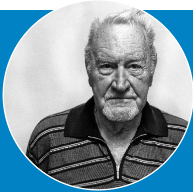
Meneer Mus (87)

Levensverwachting korter dan drie maanden