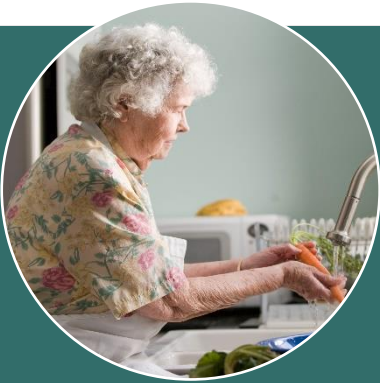
Mevrouw Walters (82)

Laatst zong ze zelfs een solo, als verrassing voor haar kinderen en kleinkinderen die ze allemaal had uitgenodigd. Het maakt haar niet meer uit wat mensen daar van vinden, ook al wil ze absoluut niet truttig gevonden worden. Ook heeft ze veel sociale contacten door het koor, dat vindt ze ook het belangrijkste aspect. Door de Covid-19 maatregelen gaat het koor helaas momenteel niet door. Daardoor zit ze meer thuis en voelt ze zich soms eenzaam. Ze belt wel veel met de mensen van haar koor, zo spreken ze elkaar toch nog regelmatig. Haar andere hobby is lezen, maar haar zicht gaat achteruit dus dit wordt steeds lastiger. Omdat ze gezond probeert te leven en positief in het leven staat ziet ze er altijd stralend uit, maar het is wel eens de vraag of ze zich ook echt zo stralend voelt.