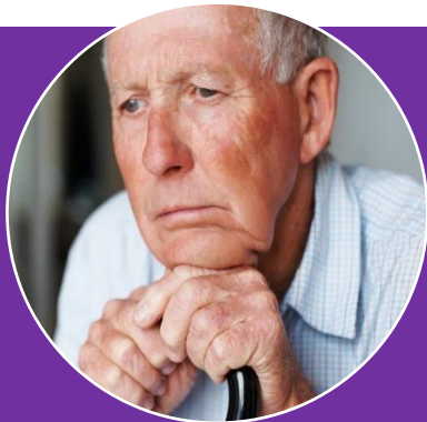
Meneer Brain (77)

Ervaren ernstige klachten in verschillende domeinen