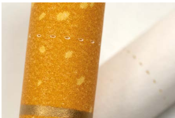
Figuur 1. Ventilatiegaatjes in het filter van een sigaret