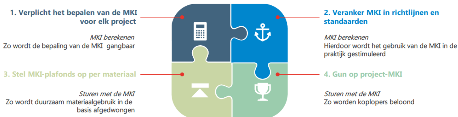
Figuur 1: Uitkomst verkenning: voorstel voor combinatie in de dwingende verankering MKI